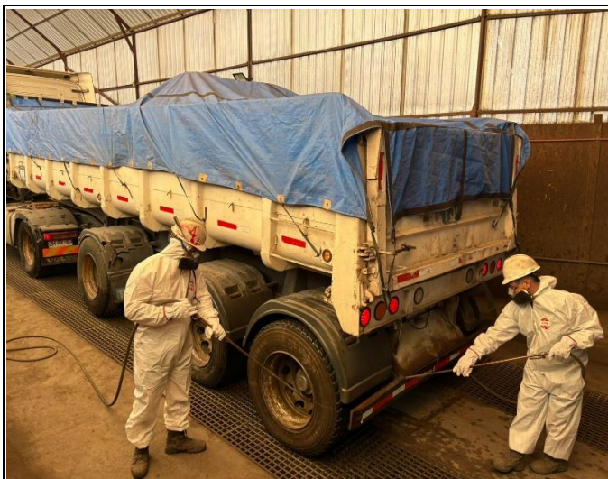
1. Limpieza de las tolvas y antes de su despacho.