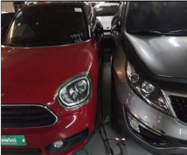
17. Separación de vehículos usados al interior de la nave.