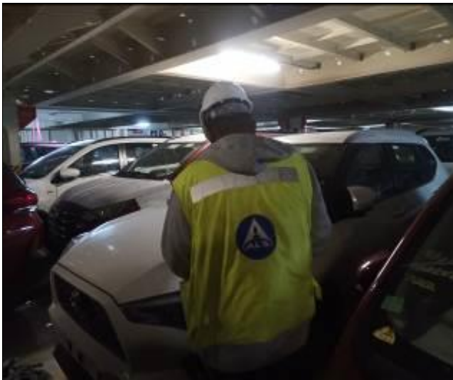
7. Personal realizando el check list a bordo de la nave