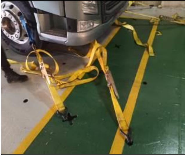
5. Trinca a bordo de la nave en camiones