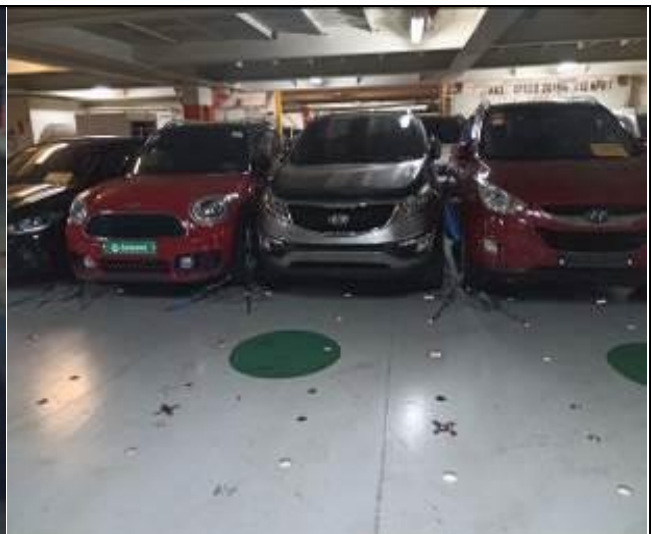
4. Vehículos usados al interior de la nave.