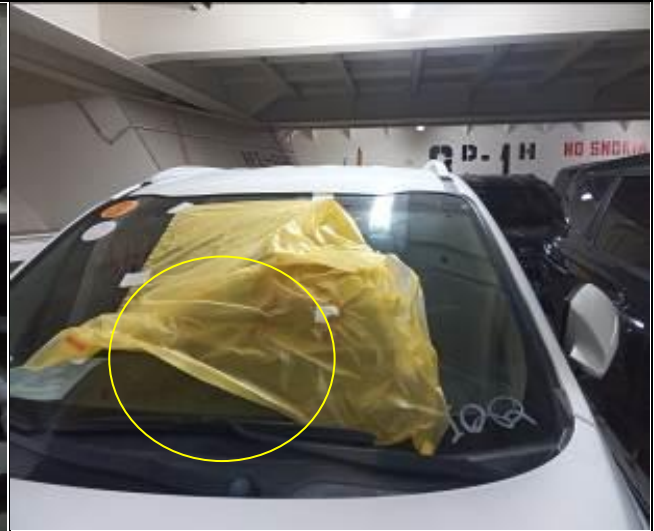
14. Vista de parabrisa trizado en vehículo usado