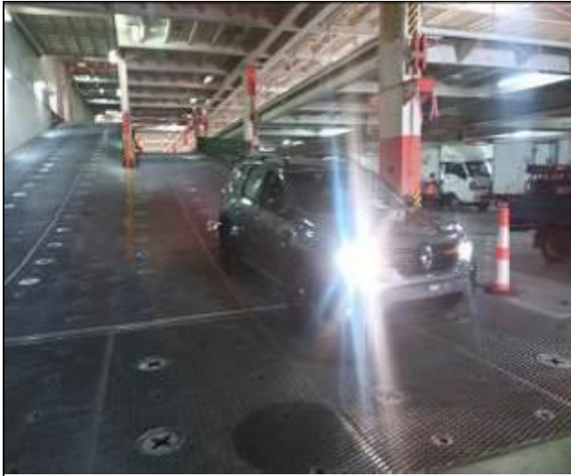
9. Vehículo bajando de la cubierta por rampa interior, para ser descargado por rampa principal de la nave