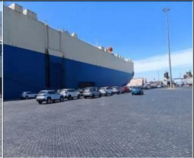
22. Vehículos camiones y maquinarias descargados al costado de la nave