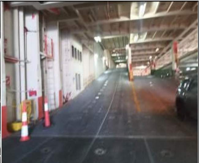
18. vista de rampa interior