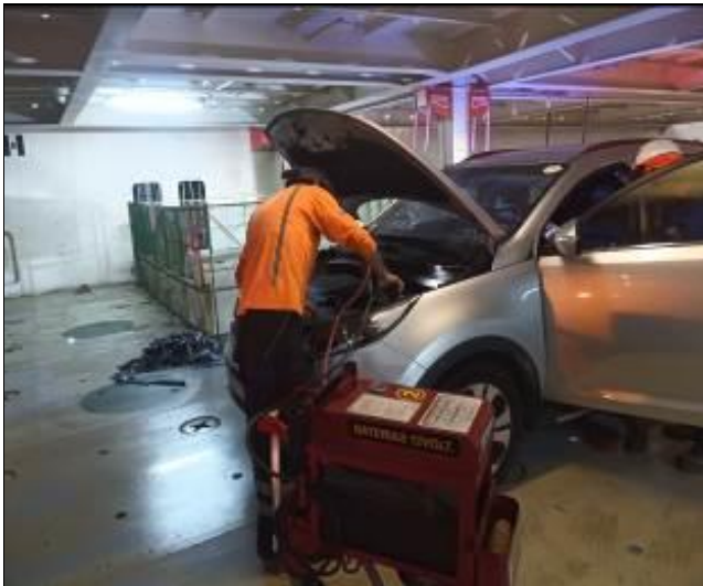
19. Personal mecánico eléctrico prestando ayuda