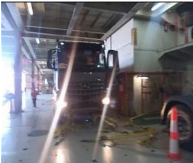
3. Camión a bordo de la nave