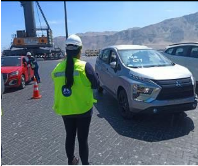
21. Contra entrega de los vehículos al costado de nave.