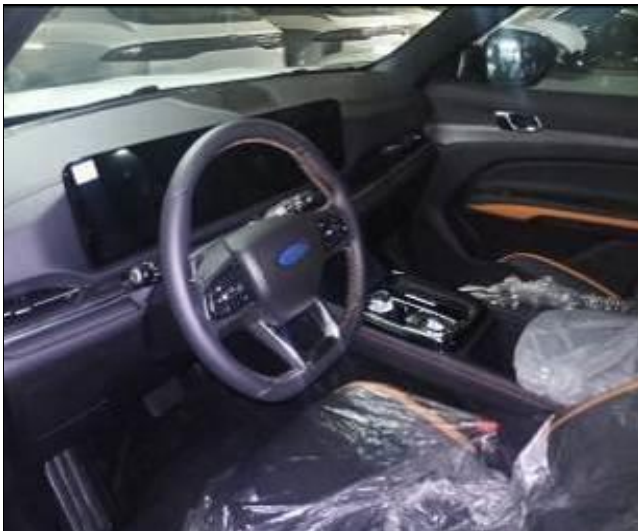
11. Interior de vehículo nuevo, con todos sus accesorios