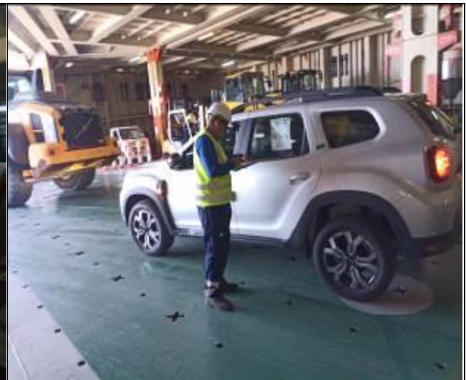
8. Control de tarjeta a bordo de la nave.