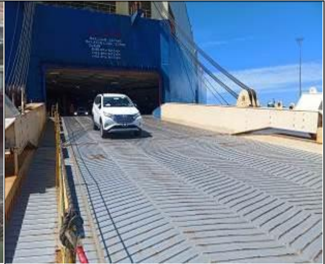
10. Vehículos nuevo siendo descargado por la rampa principal.