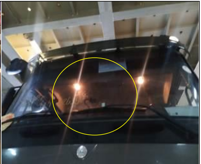
20. Parabrisa trizado en camión a bordo de la nave.