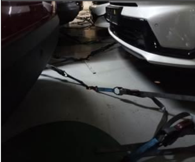
13. Trinca a bordo de la nave en vehículos nuevos