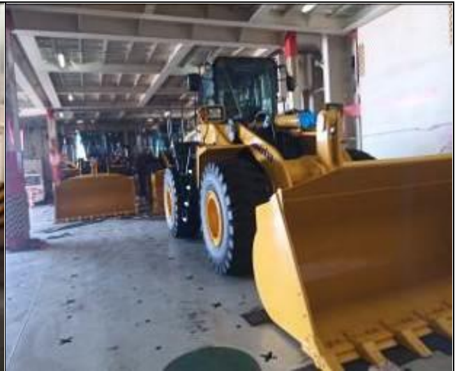
2. Maquinaria pesada a bordo de la nave.