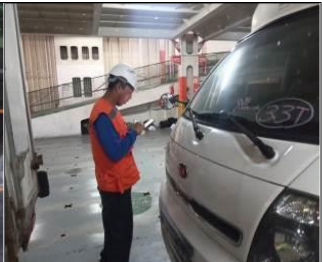
12. Internador a bordo de la nave