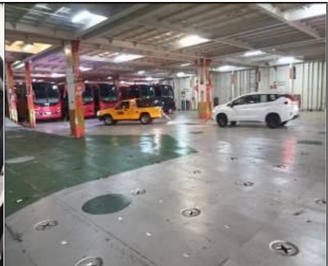
16. Vehículo Remolcado por falta de combustible.