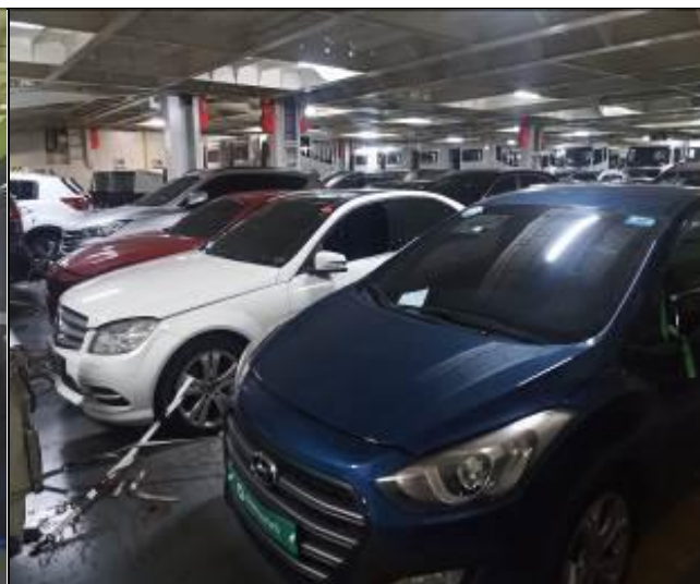
4. Vehículos usados al interior de la nave.