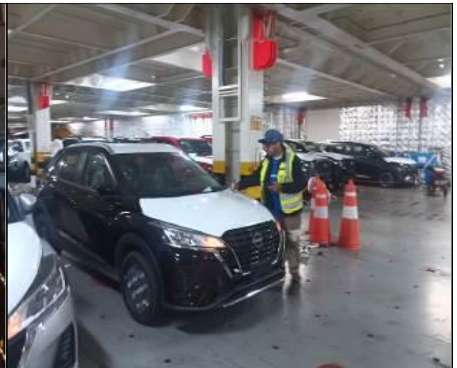
12. Internador a bordo de la nave.