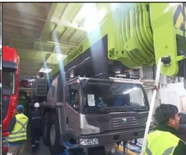
2. Maquinaria a bordo de la nave.