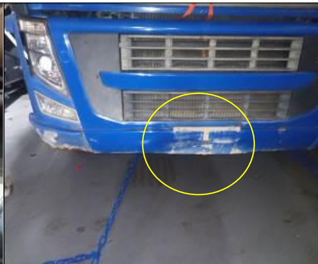
14. Parachoque delantero abollado.