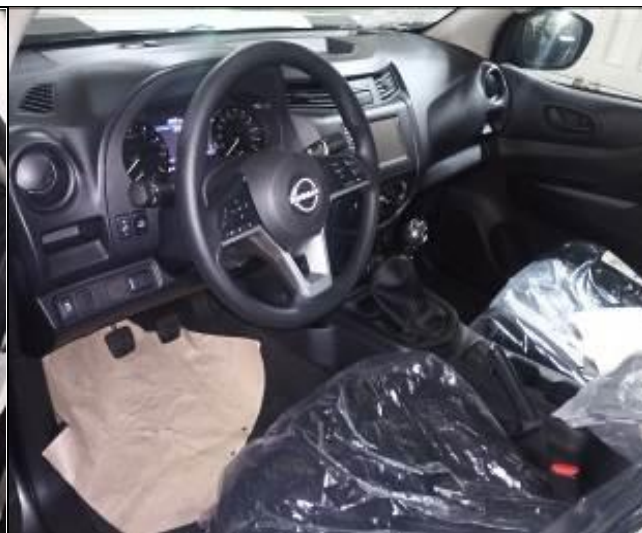
16. Interior de vehículo nuevo a bordo de la nave.