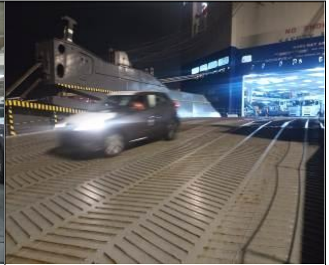
10. Vehículos nuevo siendo descargado por la rampa principal.