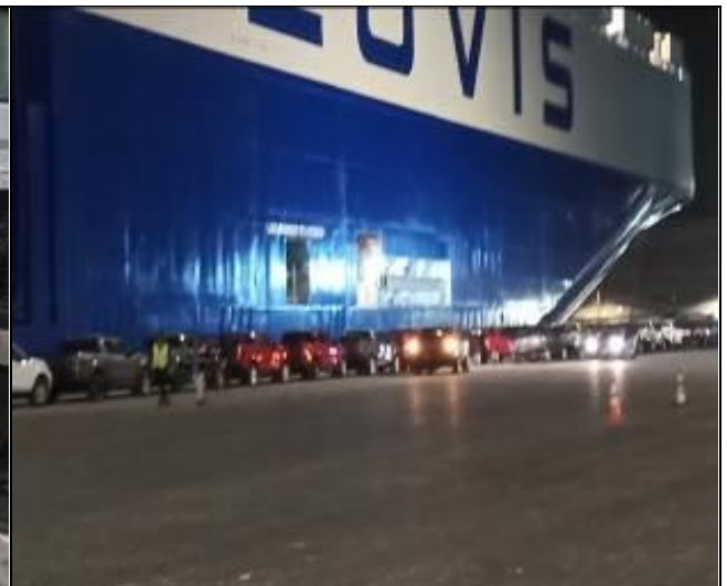
20. Vehículos descargados al costado de la nave.