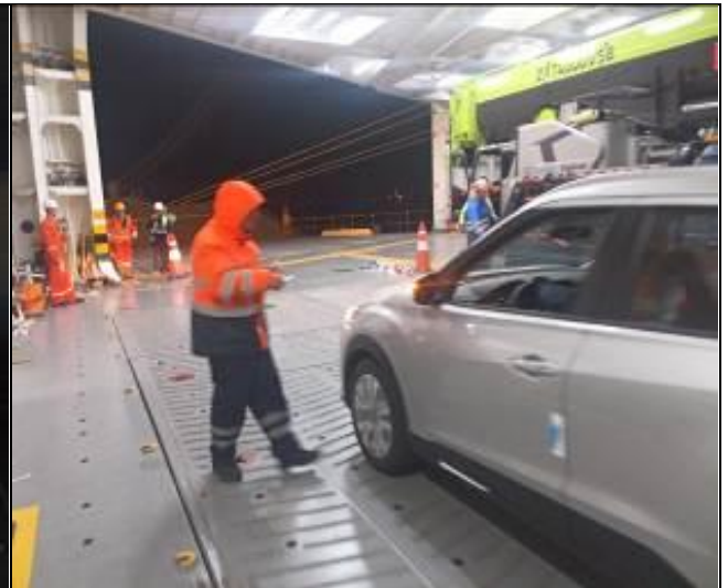
8. Control de tarja a bordo de la nave.