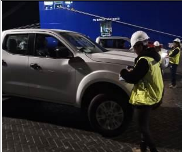
17. Contra entrega de los vehículos al costado de nave.