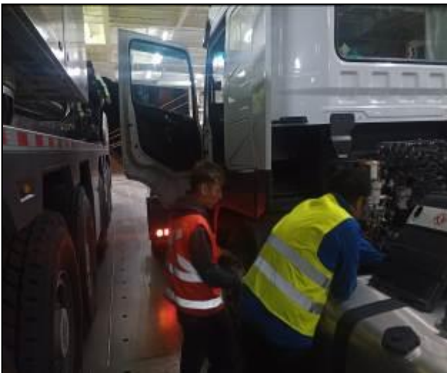
19. Personal mecánico eléctrico prestando ayuda a bordo de la nave.