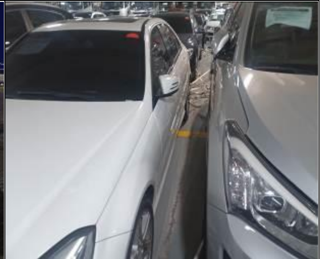
18. Separación de vehículos usados a bordo de la nave.