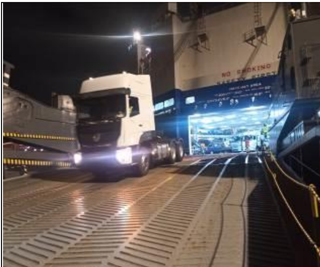
11. Camión siendo descargado por rampa principal.