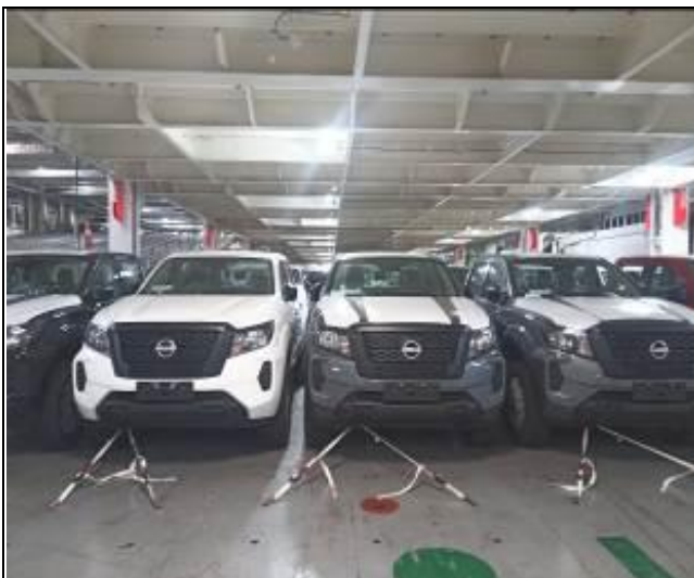
1. Vehículos nuevos al interior de la nave.