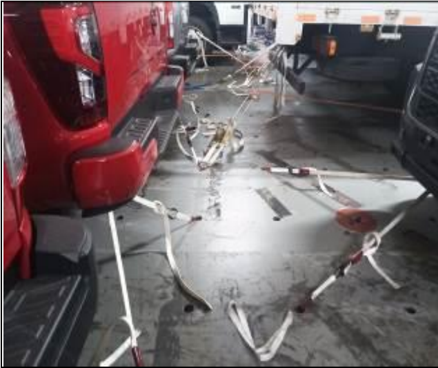
5. Trinca a bordo de la nave en vehículos nuevos.