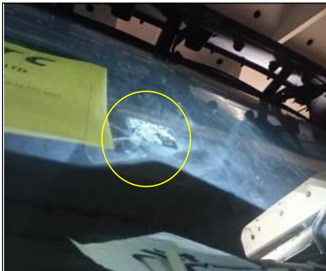
13. Parabrisa trizado.