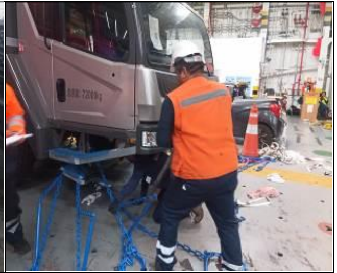
6. Personal a bordo destrincado los vehículos usados.