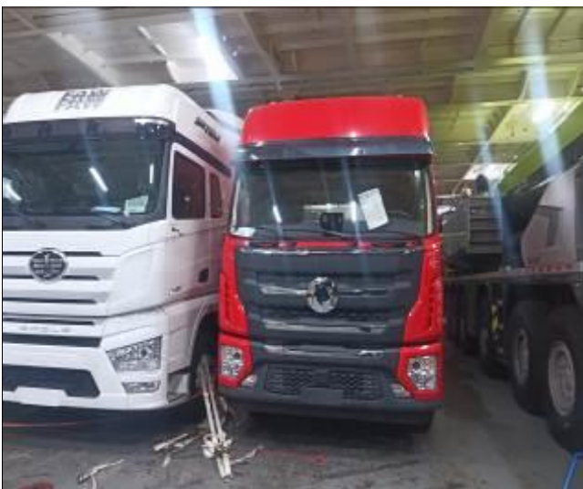
3. Camiones a bordo de la nave