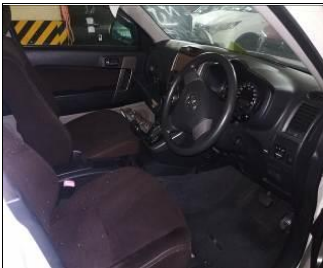
15. Interior de vehículo usado a bordo de la nave.