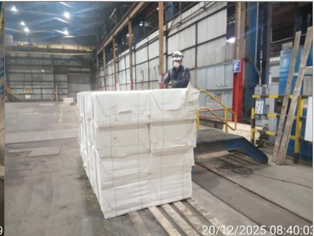
4.- vista sopleteo.