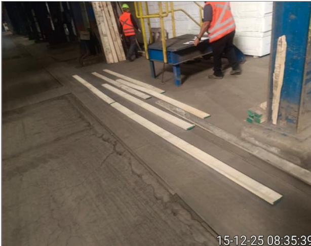
3.- Vista postura tablas limpias para posterior sopleteo units.