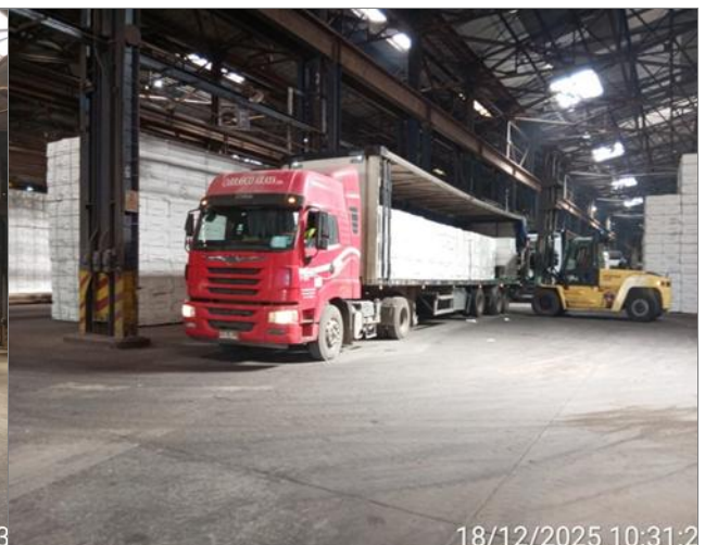
2.- Vista carga camión en bodega 205.