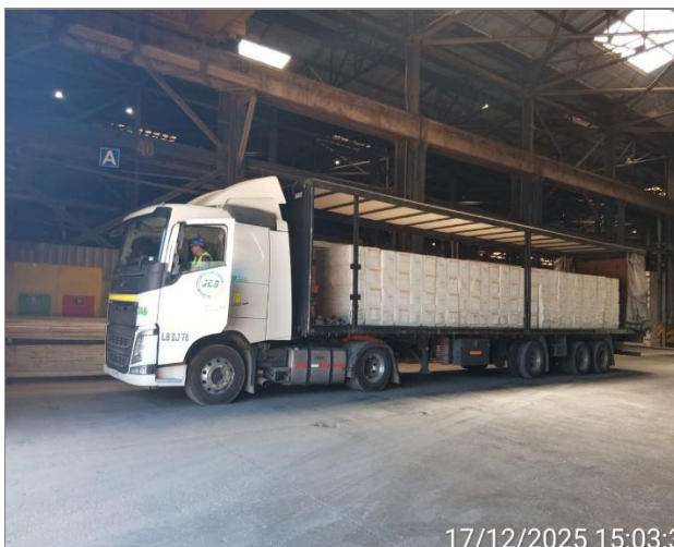
1.- Vista camión próximo a ser despachado desde bodega 206.