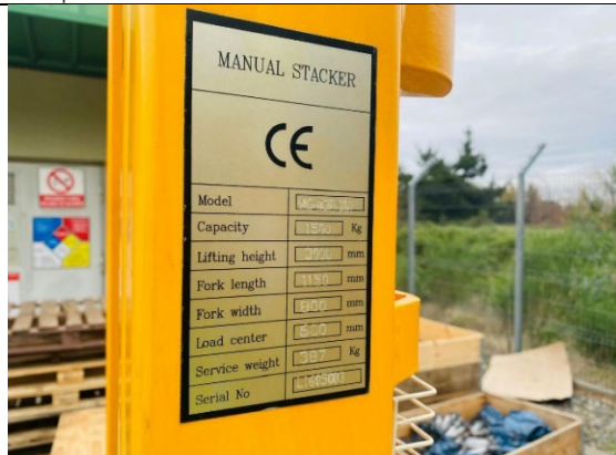
3.- Placa identificación.