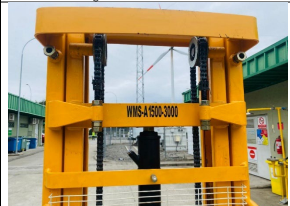
4.- Información de equipo.