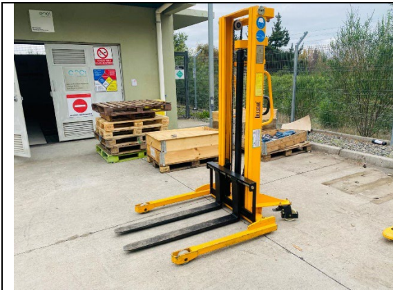
1.- Apilador hidráulico.