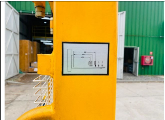
2.- Tabla de carga.