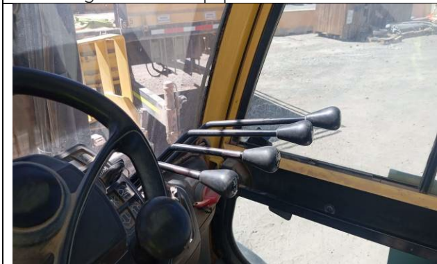
3.- Buen estado de controles del equipo.