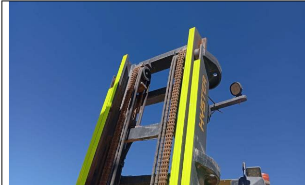
7.- Cadena de levante en buen estado.