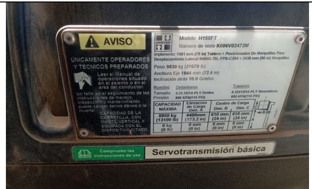
2.- Identificación del equipo.