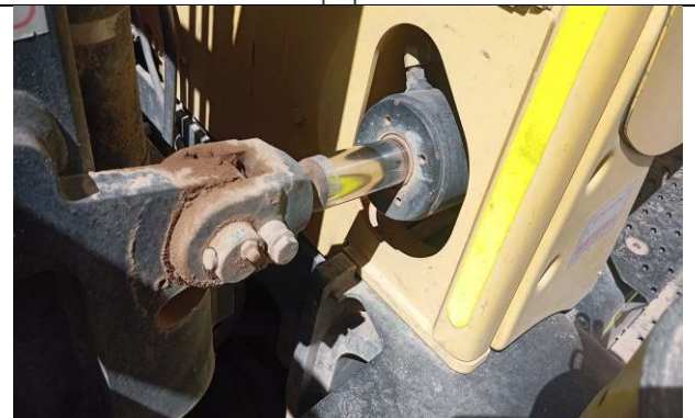
4.- Cilindros de abatimiento de la torre del equipo en buen estado.