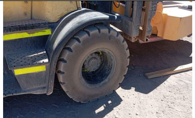
8.- Neumáticos del equipo en buen estado.