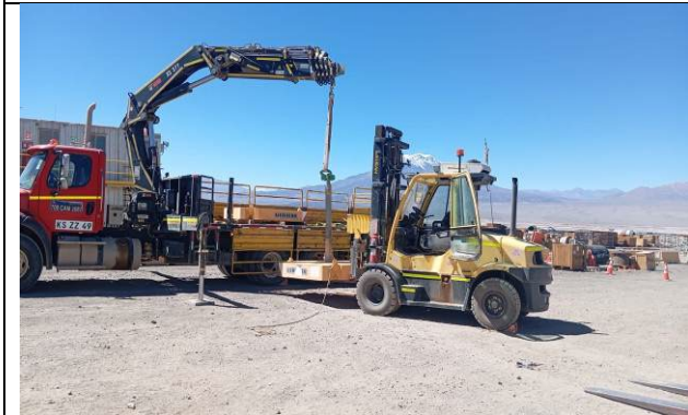
9.- Prueba de carga en proceso.