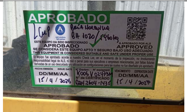
10.- Sello de prueba de carga.