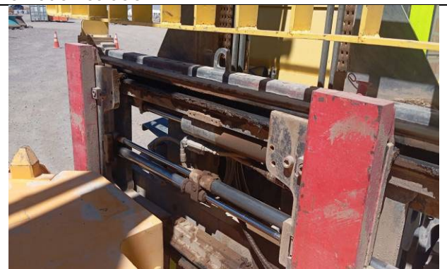
6.- Bastidor del equipo en buen estado.