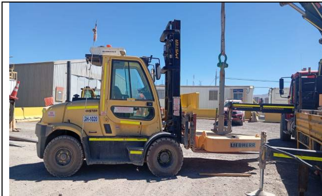
1.- Vista general del equipo.