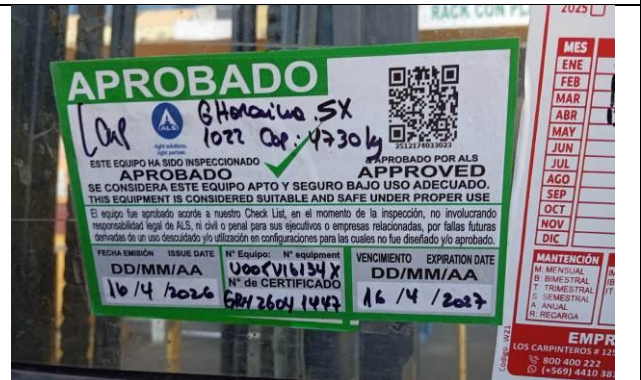
12.- Sello de prueba de carga.