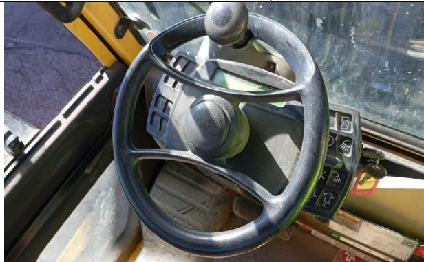
5.- Control de dirección en buen estado.