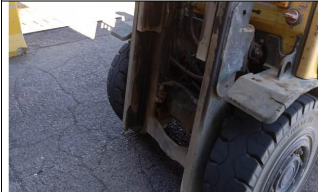
9.- Guías de levante del bastidor de la grúa en buen estado.