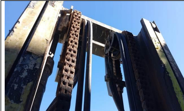
7.- Cadena de levante en buen estado.