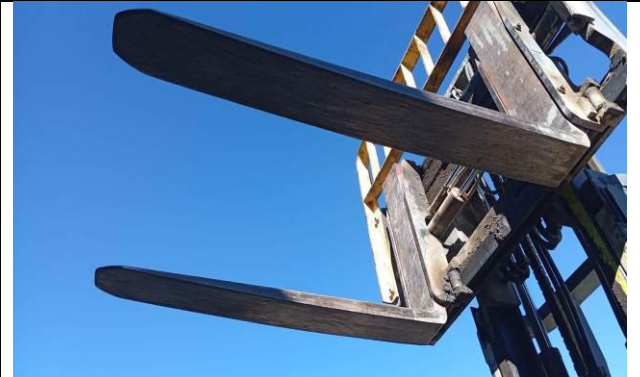
4.- Torre de levante del equipo en buen estado.