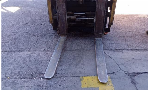
3.- Buena alineación de las horquillas.