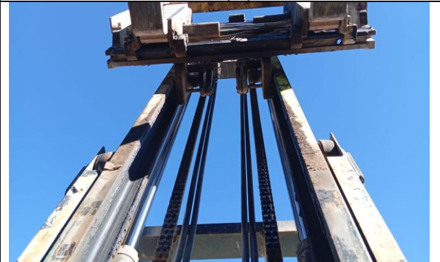
6.- Cilindros de levante en buen estado.