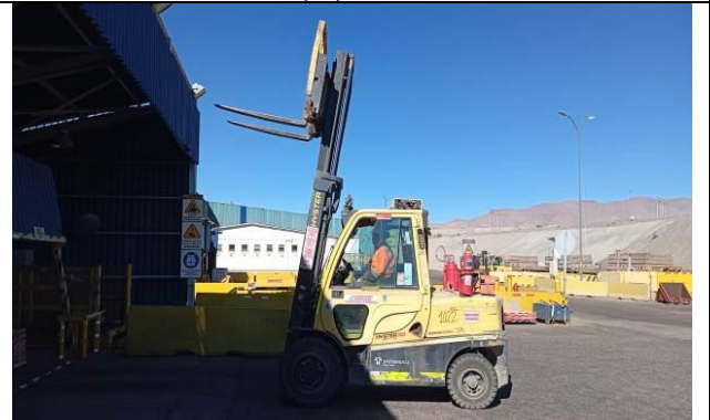
10.- Pruebas del equipo en vacío.