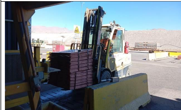
11.- Prueba de carga en proceso.