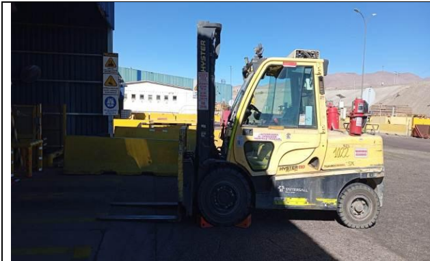
1.- Vista general del equipo.