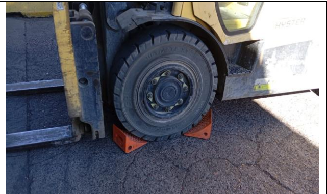
8.- Neumáticos del equipo en buen estado.