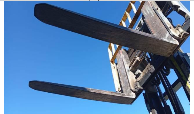
4.- Torre de levante del equipo en buen estado.