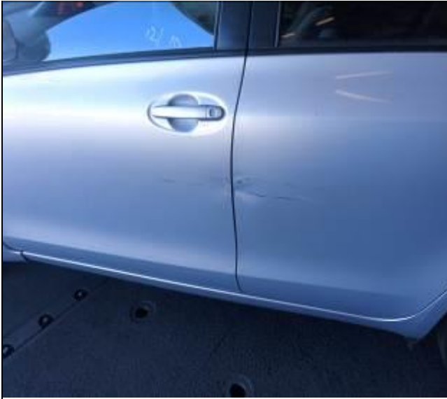
13. Vehículo usado abollado en puertas izquierda delantera y trasera.