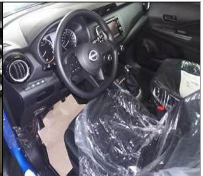
16. Interior de vehículo nuevo a bordo de la nave.