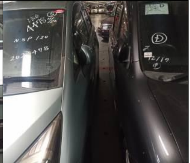
6. Separación de vehículos usados a bordo de la nave.