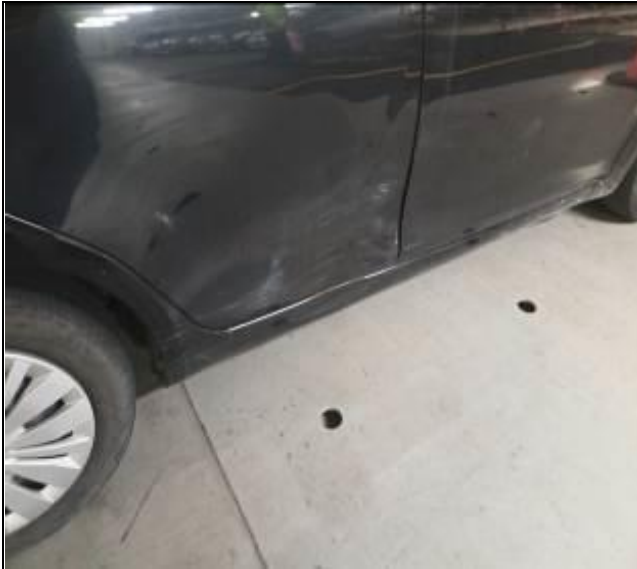
21. Vehículo usado con puerta trasera derecha abollada.