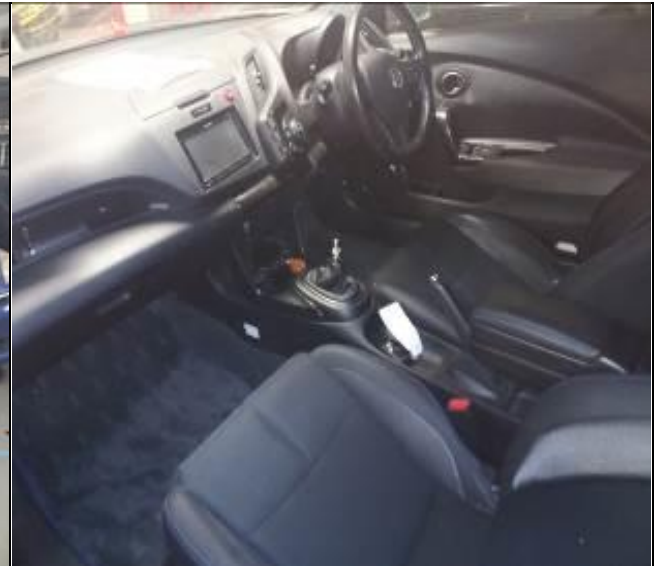
4. Vista interior de vehículo usado.