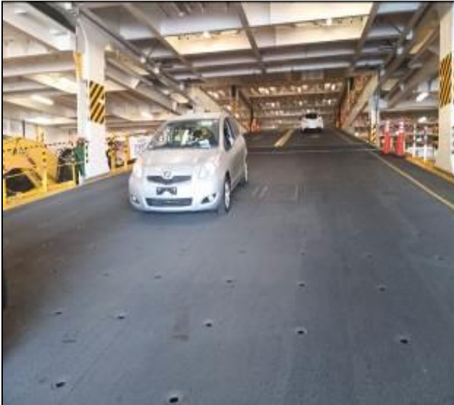
17. Vehículo usado bajando por rampa interior.