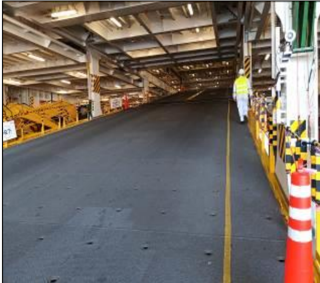
9. Vista de rampa interior.