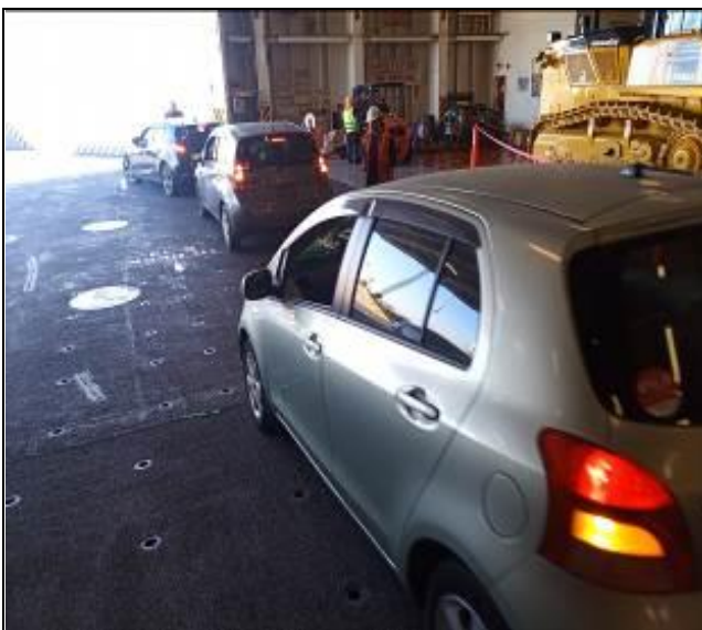
19. Vehículos en espera para ser descargado por rampa principal.