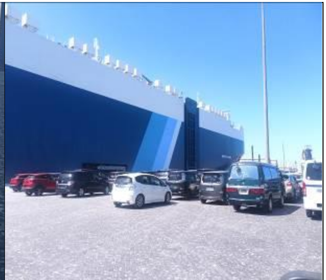
24. Vehículos descargados al costado de la nave.