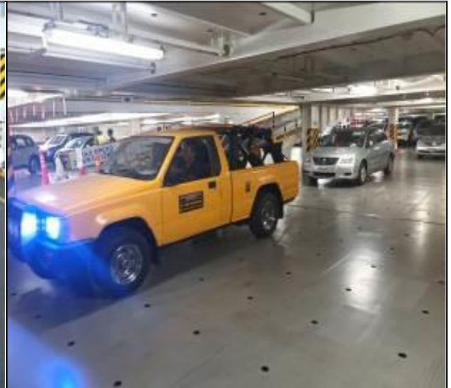
18. Vehículo siendo remolcado por falta de combustible.