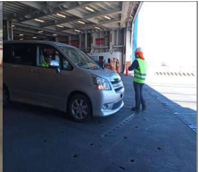
8. Control de tarjeta a bordo de la nave.