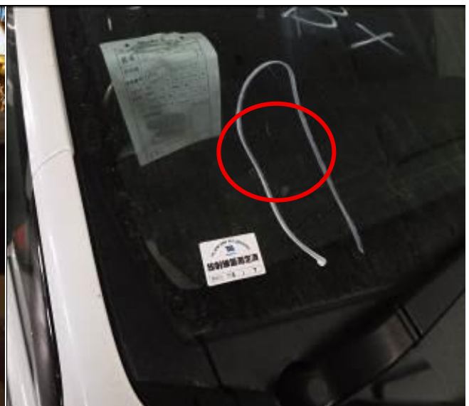
20. Vista de parabrisas trizado a bordo de la nave.