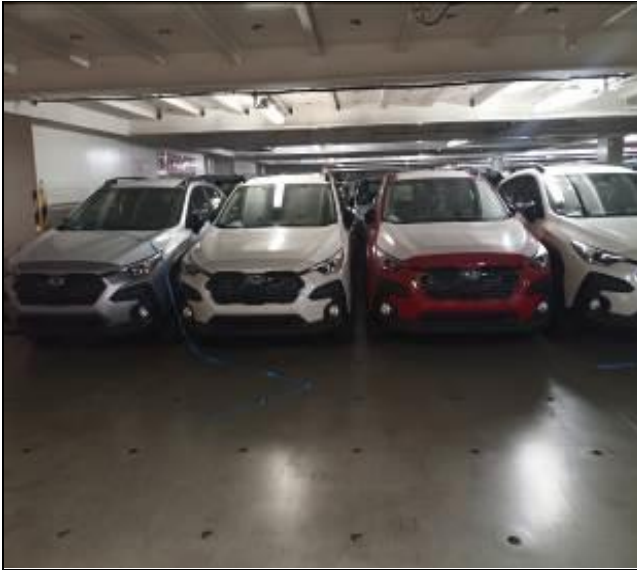
1. Vehículos nuevos a bordo de la nave.