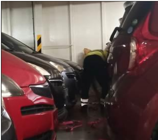
11. Personal destrincando los vehículos a bordo de la nave.