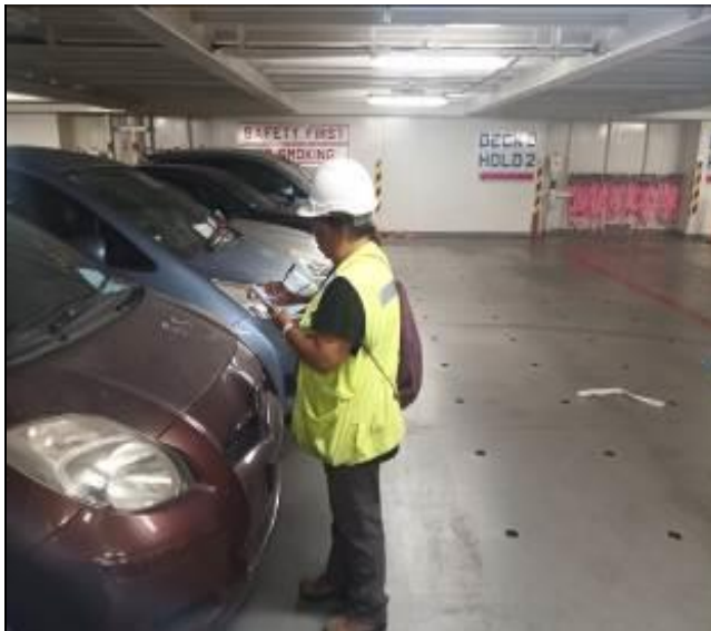
7. Personal realizando el check list a bordo de la nave.