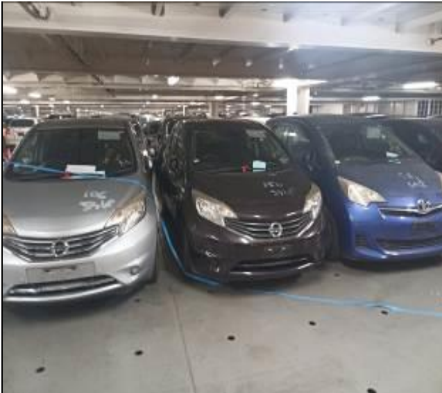
3. Vehículos usados a bordo de la nave.