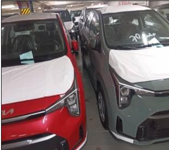
5. Separación de vehículos nuevos a bordo de la nave.