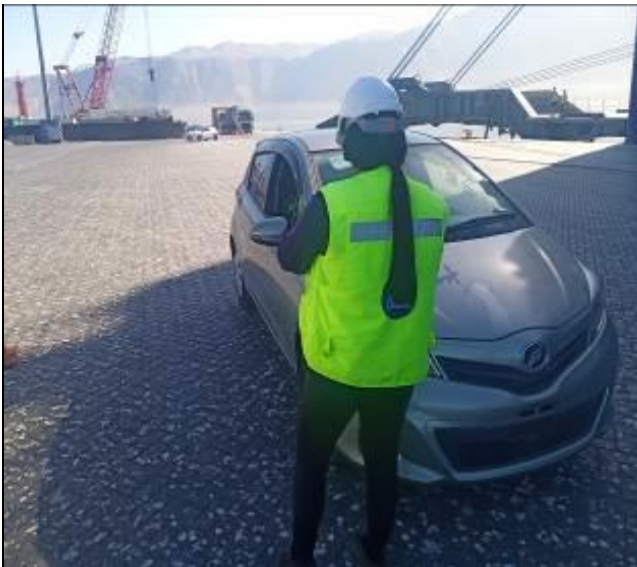
23. Vista de contra entrega de los vehículos al costado de nave.