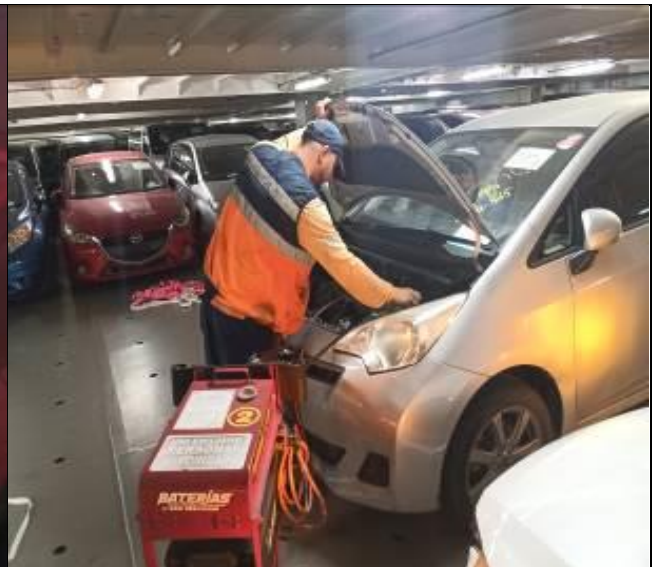
12. Personal prestando ayuda mecánica y eléctrica para el encendido de vehículos.