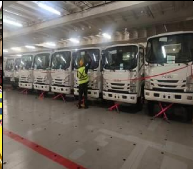
10. Internador a bordo de la nave.