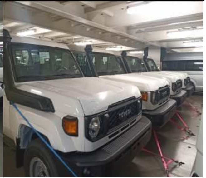
2. Otra vista de vehículos a bordo de la nave.