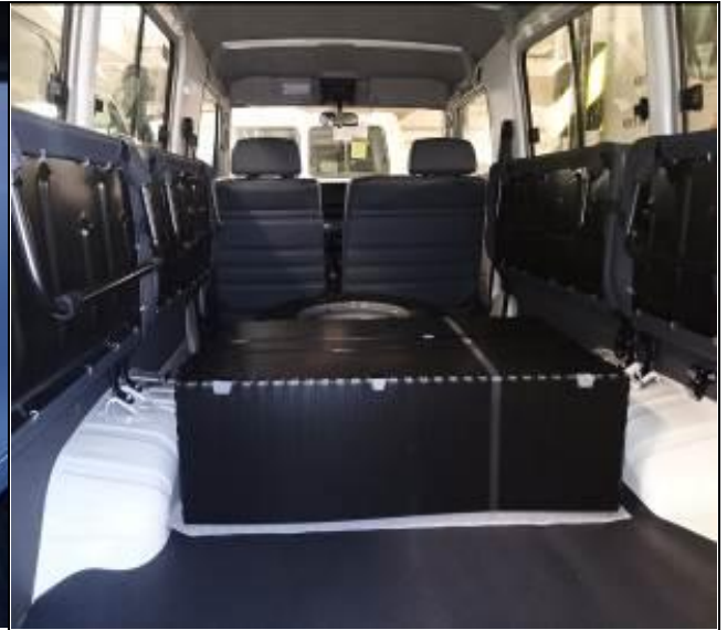
14. Vista de caja sellada en el interior de un vehículo nuevo a bordo de la nave.