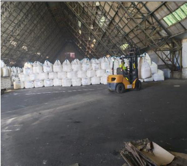
1. Carga siendo trasladada desde el sector de acopio.