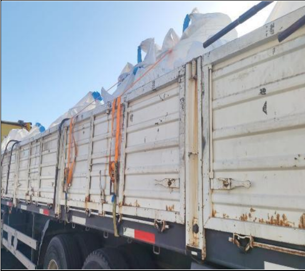
9. Carga debidamente trincada.