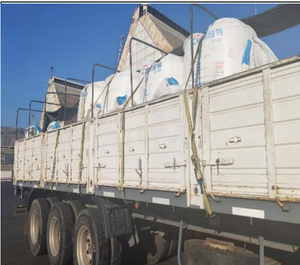
15. Carga debidamente trincada.