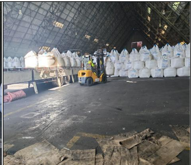
12. Camión siendo cargado.