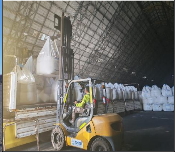
14. Camión en proceso de carguío.