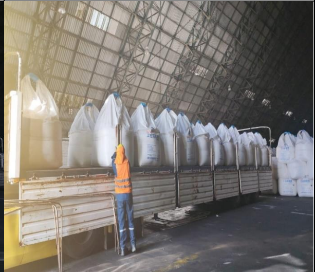
8. Camión siendo cargado