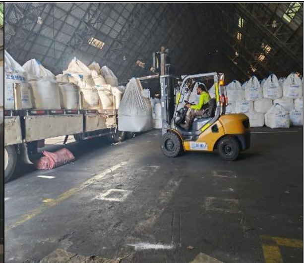
2. Big bags siendo cargados en camión.