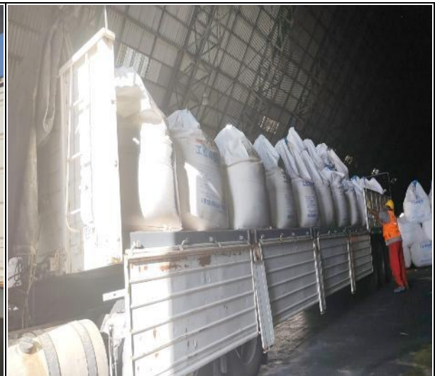
16. Camión cargado.