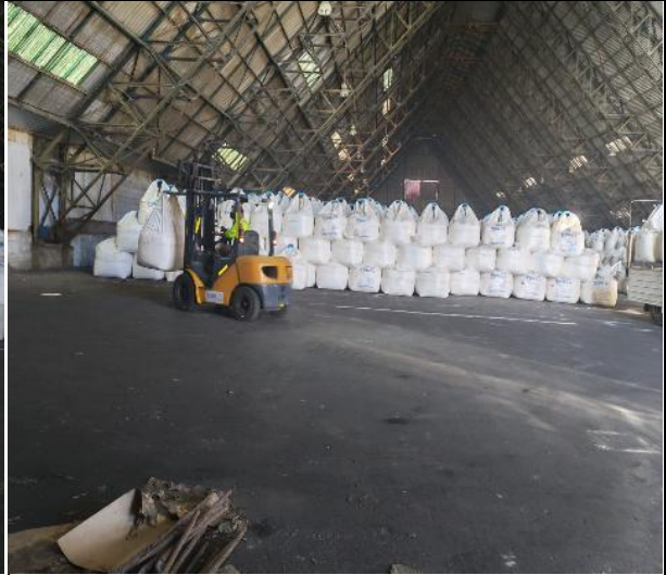
6. Carga siendo trasladada desde el sector de acopio.