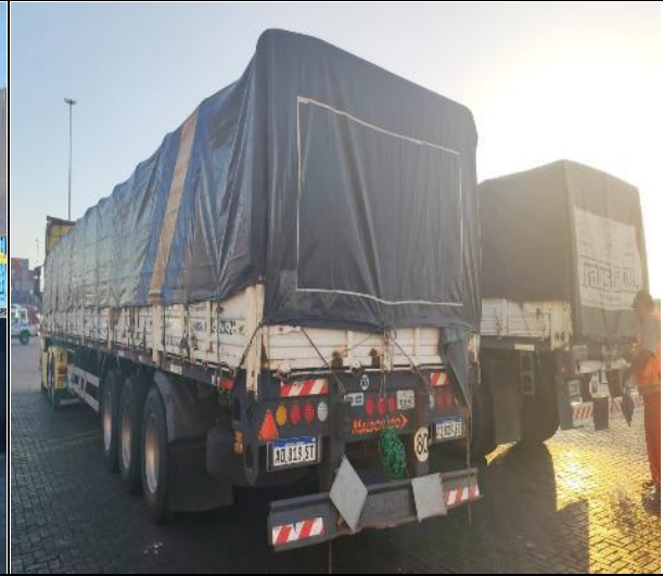
18. Otra vista de lo anterior.