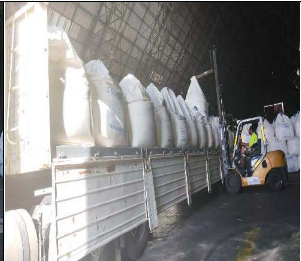
4. Camión cargado.