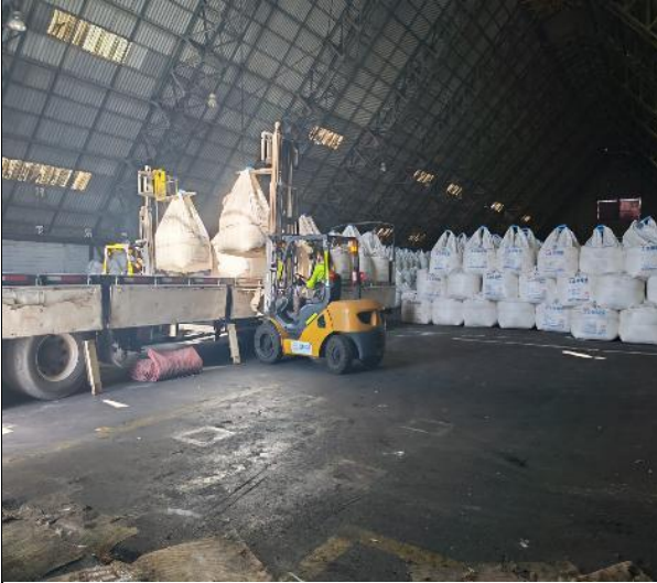
5. Carga siendo posicionada sobre camión.