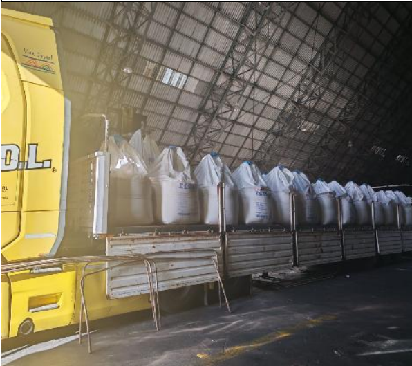
7. Camión cargado.