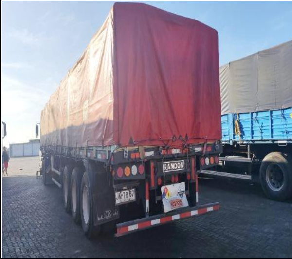
17. Camiones debidamente encarpados.