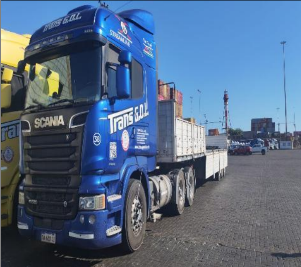
13. Camión en espera para ser cargado