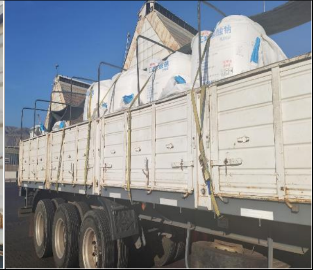
10. Carga trincada.