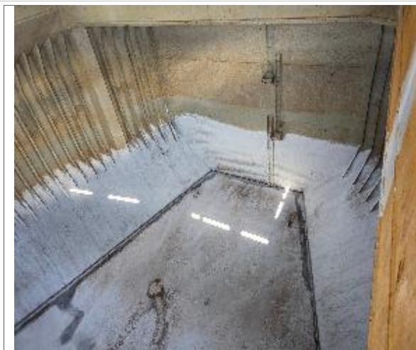
23. Vista de proa.