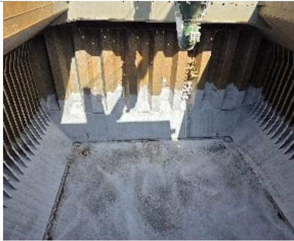
29. Proa de la bodega N° 3 correctamente encalada.