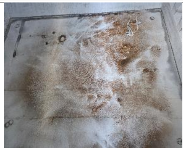
28. Fondo y popa de la bodega.