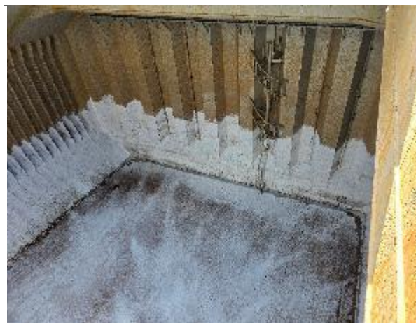
35. Vista a popa de la bodega.