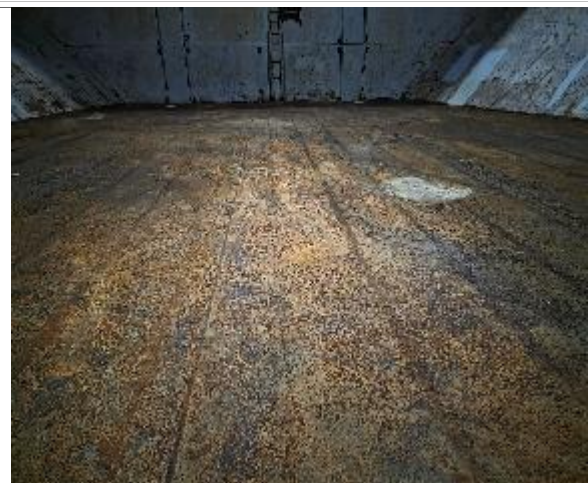
20. Vista a fondo sin restos de carga.