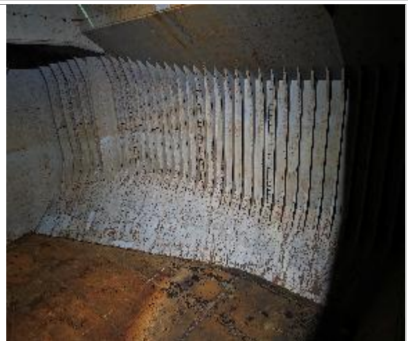
2. Vista banda de estribor apta para encalar.