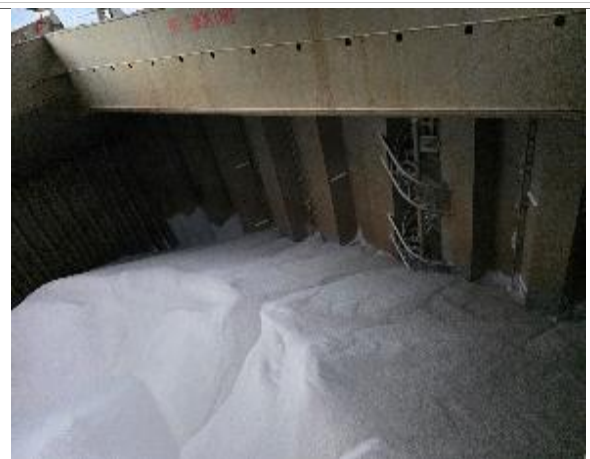
44. Vista hacia popa de bodega N° 2 cargada.