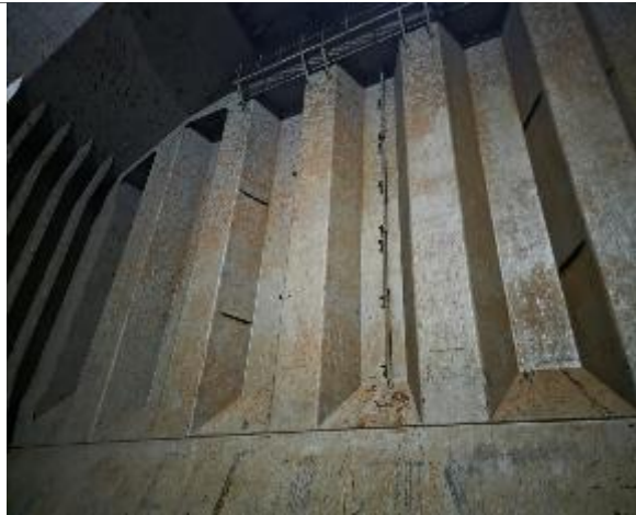
5. Vista general del mamparo de proa, apta para encalar.