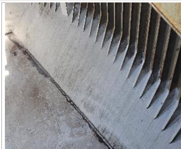
27. Vista de babor.