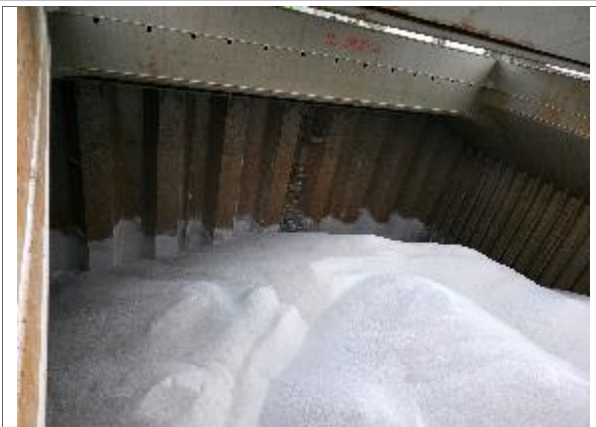
48. Vista hacia popa de bodega N° 4 cargada.