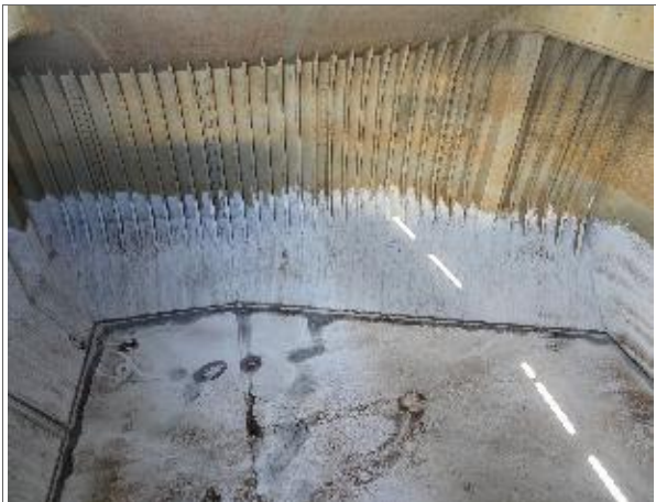
22. Banda de babor de la bodega.