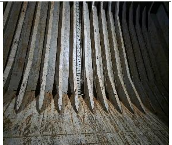
8. Vista a babor apta para encalar.