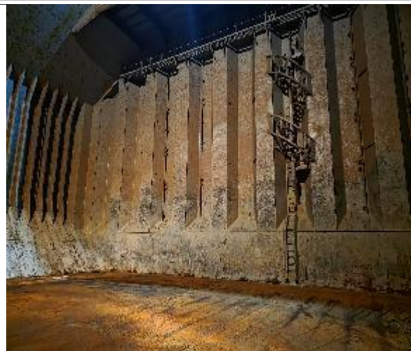
16. Vista de popa sin restos de carga.