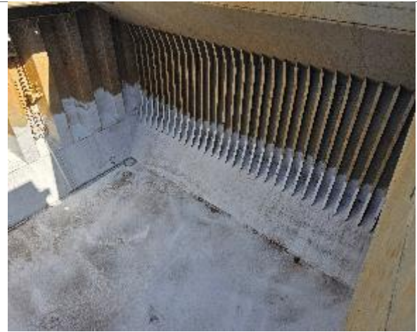
30. Estribor y fondo encalado.