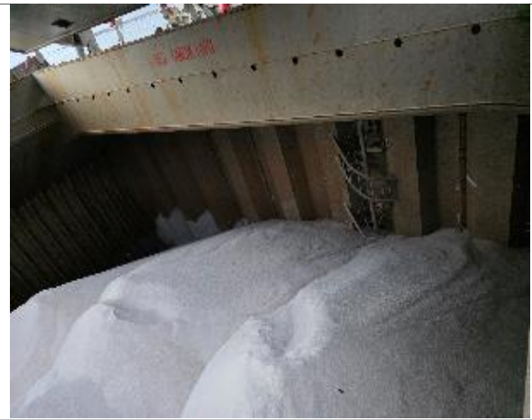
50. Vista general de bodega N° 5 cargada.