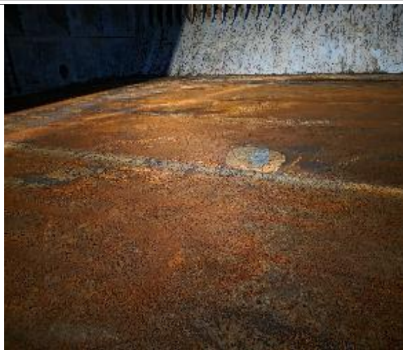
15. Fondo de la bodega.