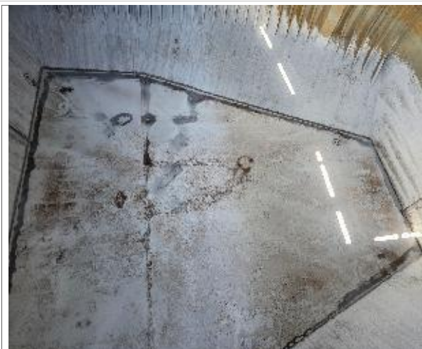
24. Vista a fondo debidamente encalado.