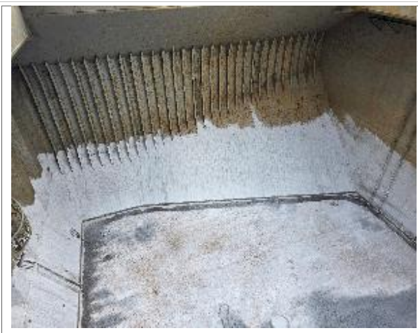
40. Banda de estribor debidamente encalada.