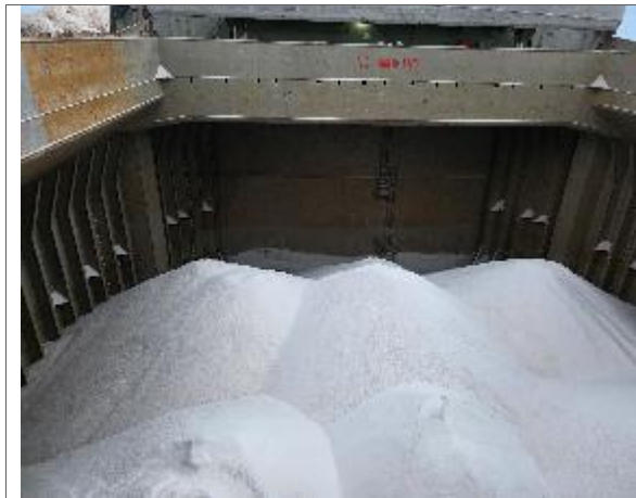
41. Vista hacia proa de bodega N° 1 cargada.