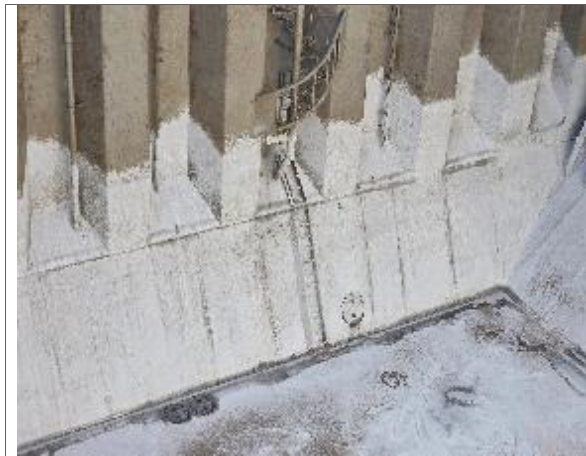
21. Vista a popa de la bodega N° 1 encalada.