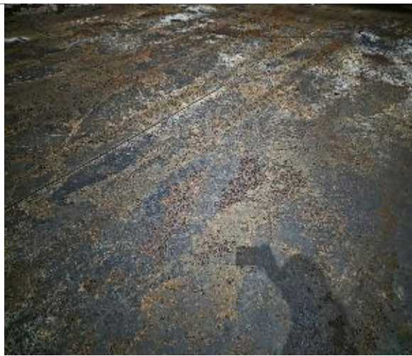
7. Vista del piso de la bodega.