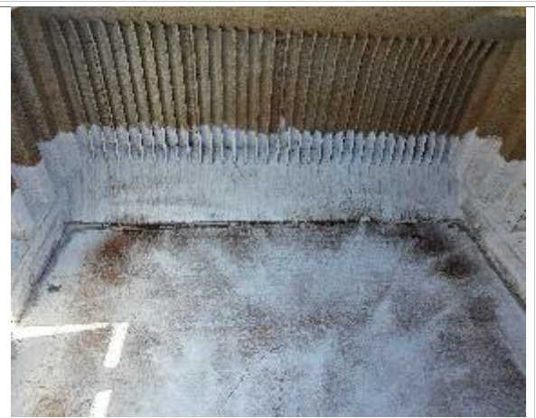
36. Banda de estribor debidamente encalada.