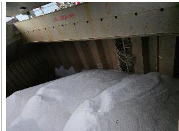
47. Vista hacia proa de bodega N° 4 cargada.