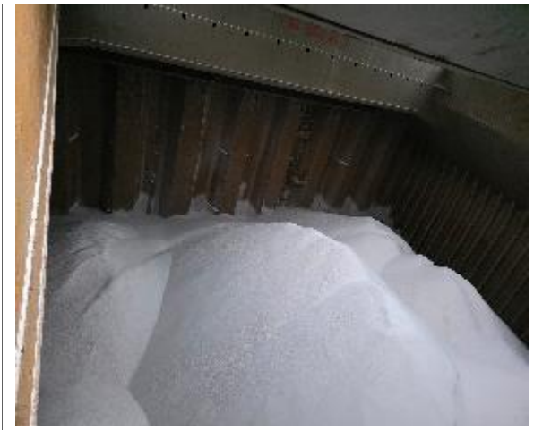
46. Vista hacia popa de bodega N° 3 cargada.