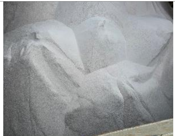
42. Vista hacia popa de bodega N° 1 cargada.