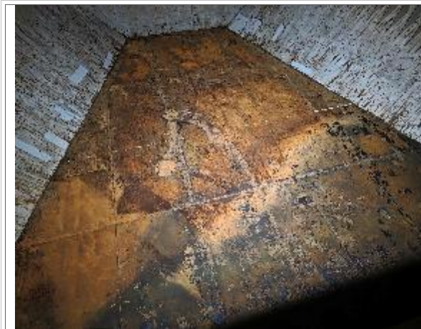
3. Fondo sin restos de carga.