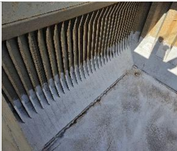
31. Babor de la bodega y fondo.