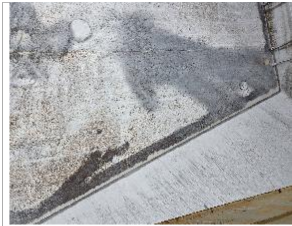
37. Babor encalado.