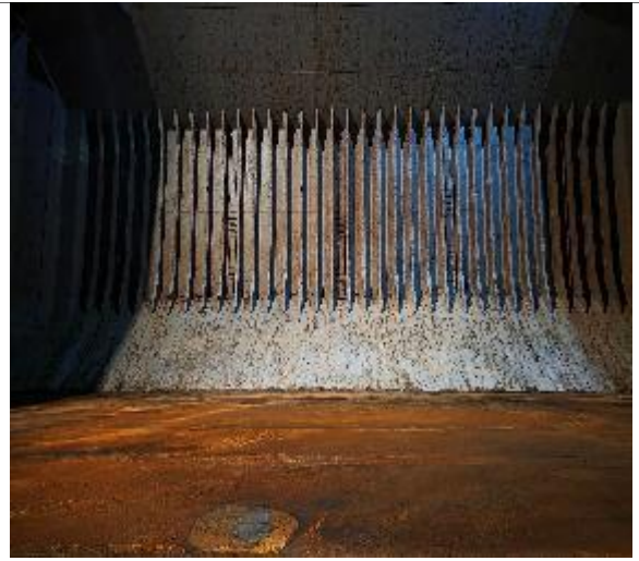
14. Banda de estribor en condiciones de encalar.