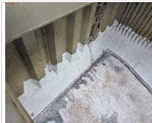
39. Vista a proa de la bodega.