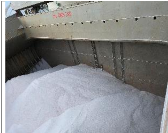
49. Vista hacia popa de bodega N° 5 cargada.