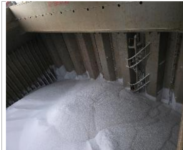
45. Vista hacia proa de bodega N° 3 cargada.