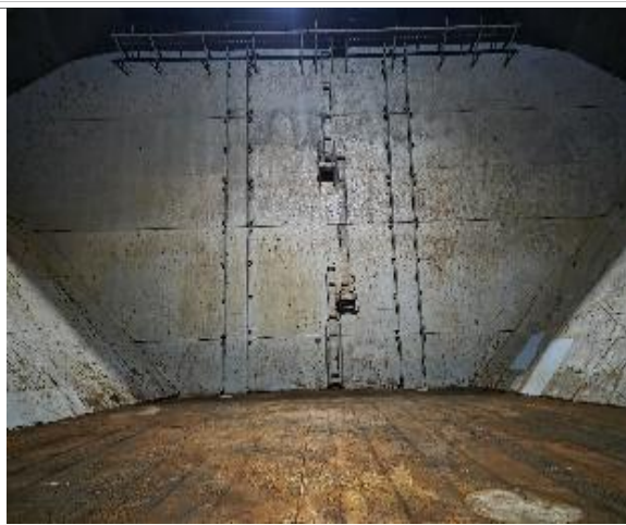
19. Popa sin restos de carga.