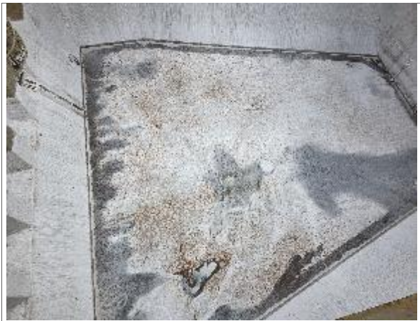
38. Vista a fondo debidamente encalado.