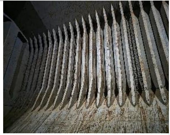
6. Vista banda estribor apta para encalar.