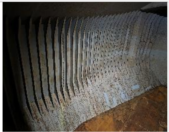
4. Vista banda de babor apta para encalar.