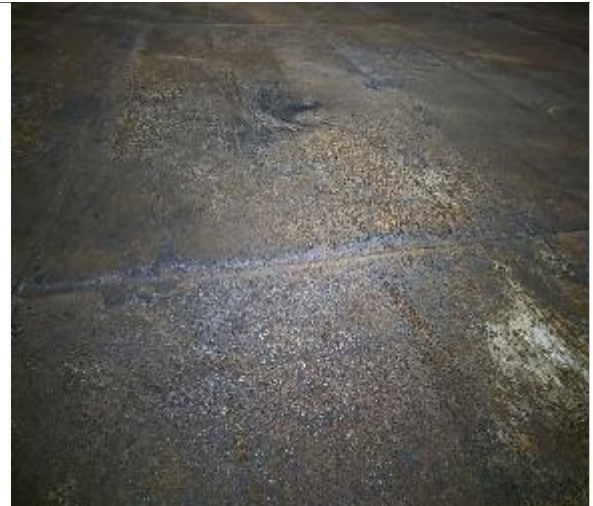
10. Vista del piso de la bodega, apta para encalar.