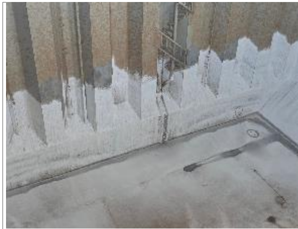
25. Proa de la bodega N° 2 correctamente encalada.