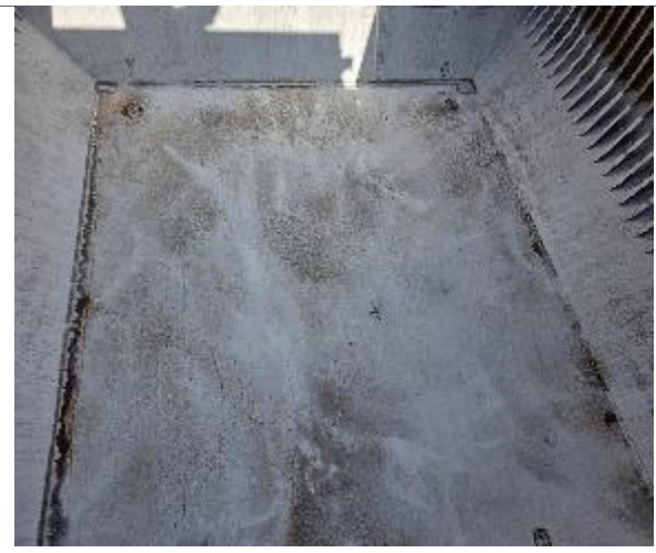
32. Fondo y popa de la bodega con película de cal.