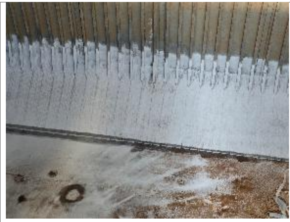
26. Estribor y fondo encalado.