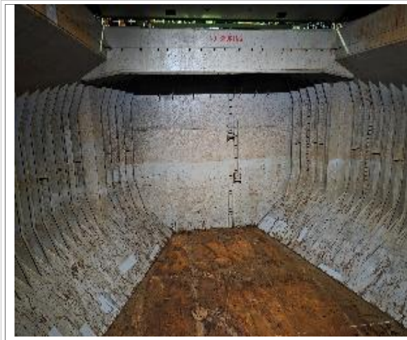
1. Vista de la proa bodega N° 1.