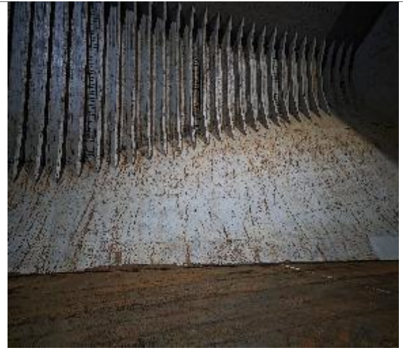
18. Banda de estribor en condiciones de encalar.