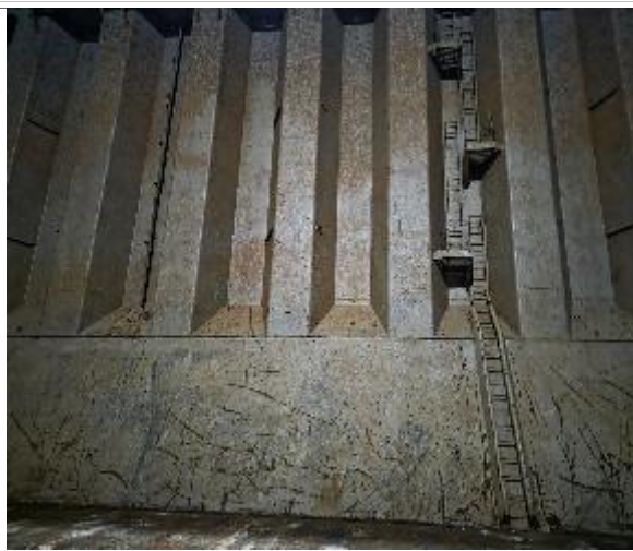
11. Vista de popa en condiciones de encalar.