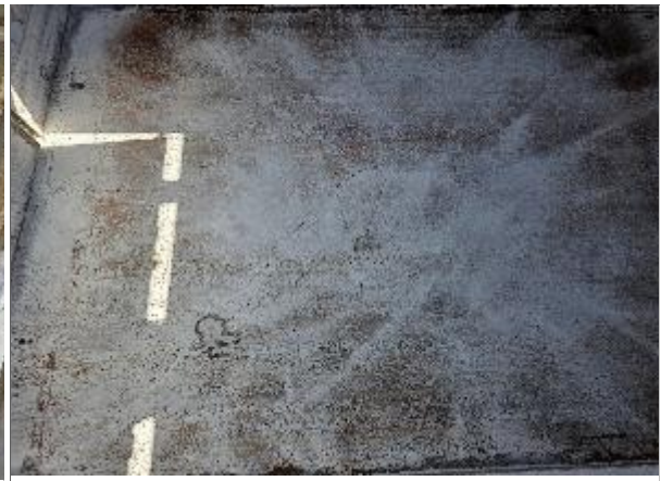
34. Vista a fondo debidamente encalado.