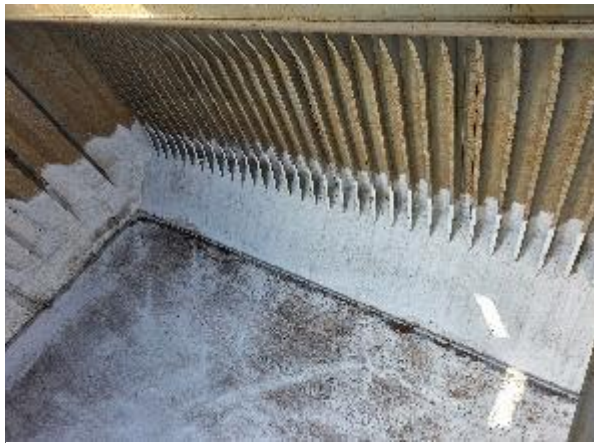
33. Babor encalado.