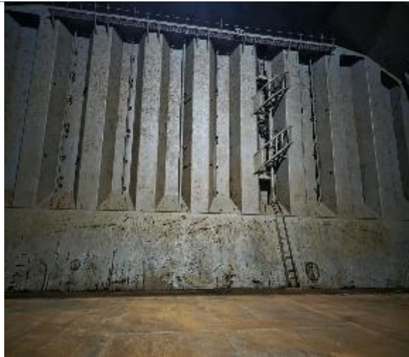
9. Vista general de mamparo de proa en condiciones de encalar.