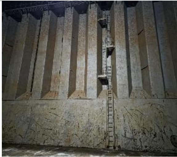
17. Mamparo de proa en condiciones de encalar.