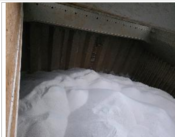
43. Vista hacia proa de bodega N° 2 cargada.