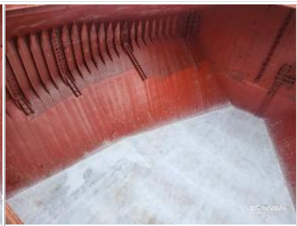
4. Babor de la bodega encalada correctamente.