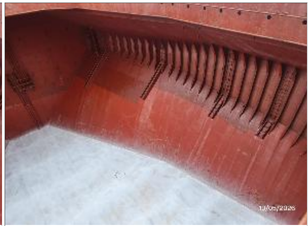
2. Estribor y fondo encalada.