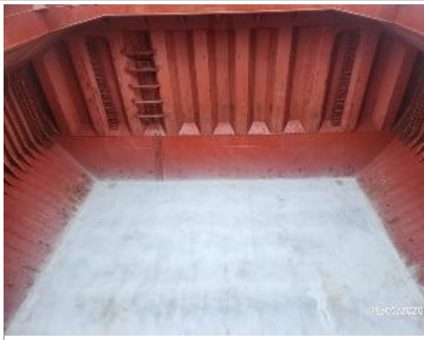
13. Proa y fondo encalado bodega N° 4.