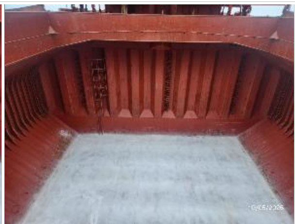
16. Popa de la bodega encalada.