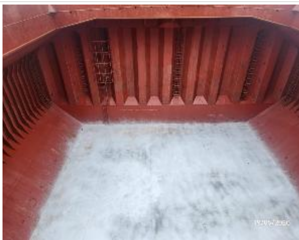
7. Vista general de la bodega.