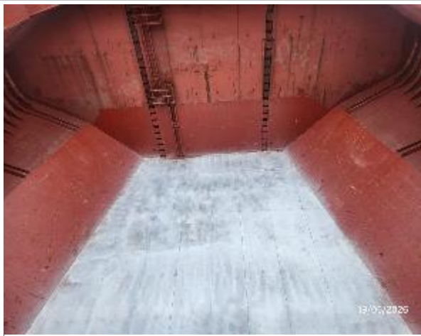
17. Popa de la bodega N° 5 encalada.