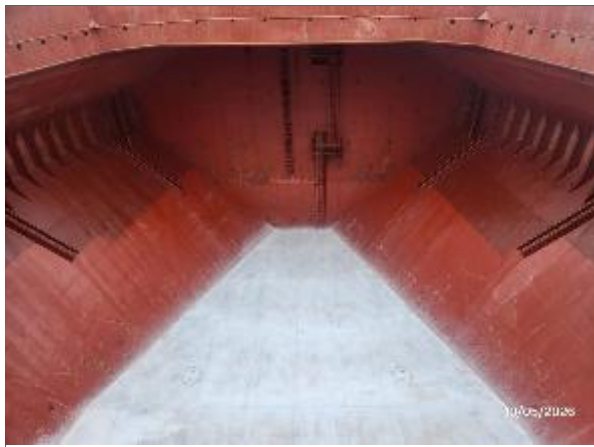
1. Proa de la bodega N°1 encalada.