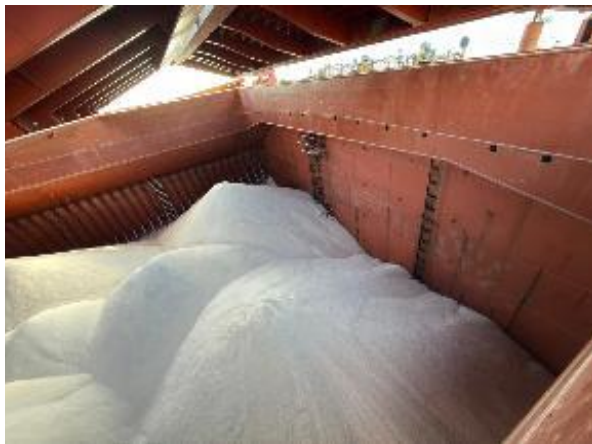
29. Popa de bodega N° 5 cargada.