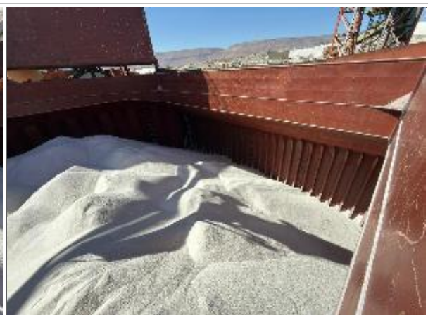
24. Babor de bodega N° 2 cargada.