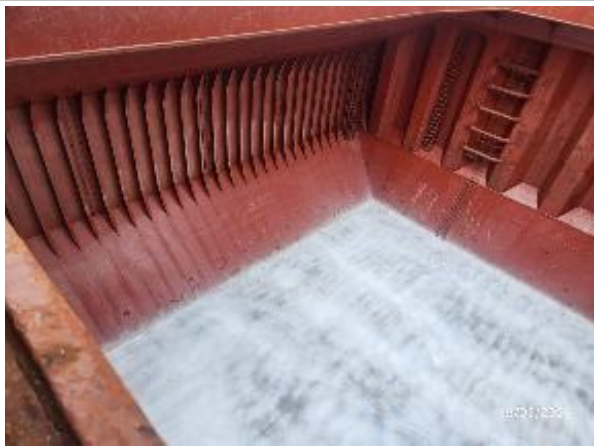
5. Banda lateral de estribor y fondo encalado.