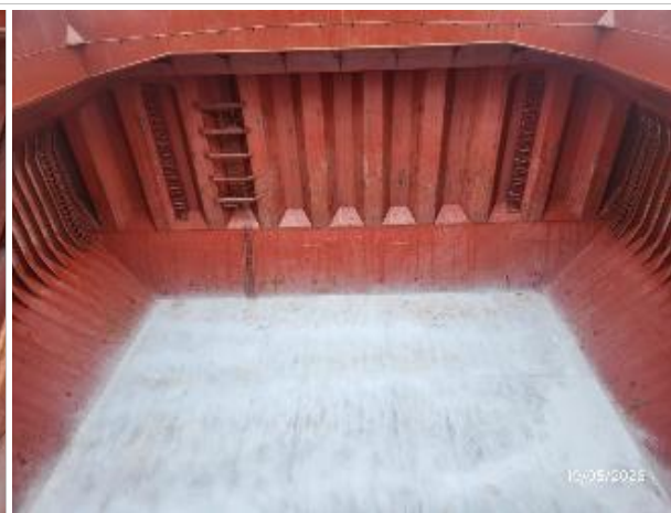
12. Popa debidamente encalada.