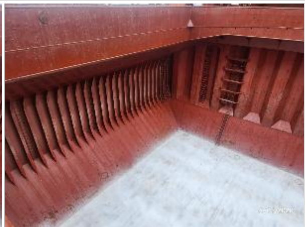
10. Estribor y fondo encalada.