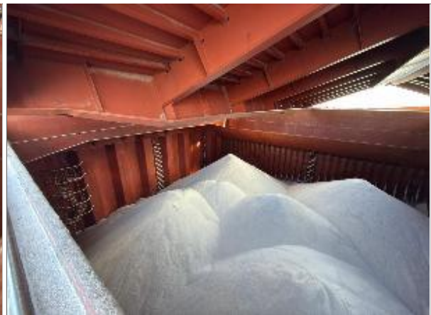
30. Proa de bodega N° 5 cargada.

El presente informe es emitido sin perjuicio alguno para el interés de quien concierna.