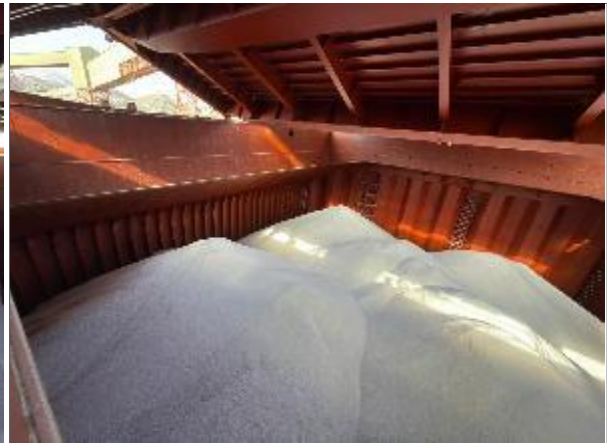
26. Popa de bodega N° 3 cargada.