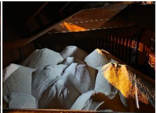
28. Babor de bodega N° 4 cargada.