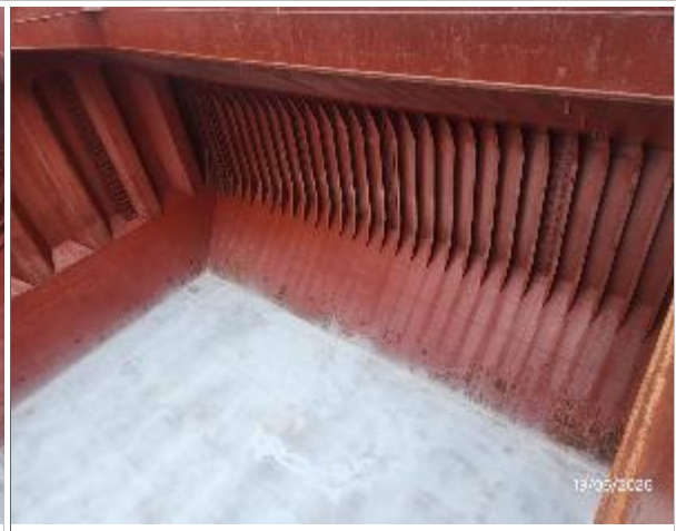
14. Banda de babor encalada.