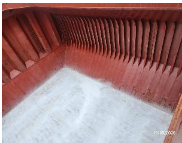
11. Babor y fondo encalada.