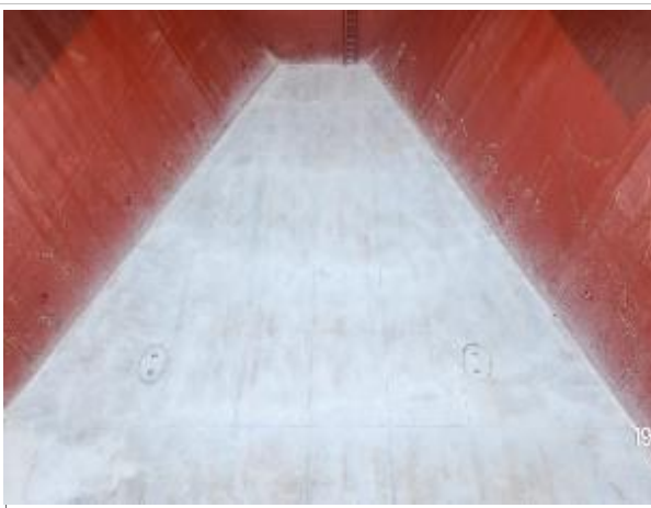
3. Fondo de la bodega No.1.