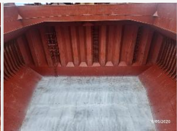
20. Proa de la bodega No. 5.