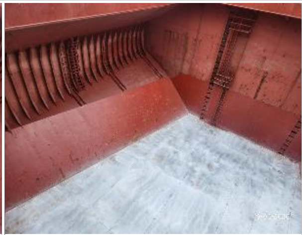
18. Banda de estribor y fondo de la bodega encalada.