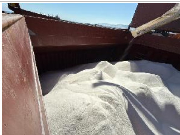
23. Estribor de bodega N° 2 cargada.