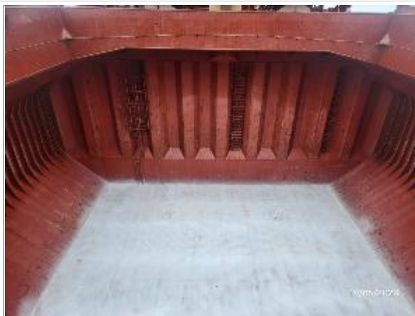
9. Proa y fondo de la bodega N° 3.