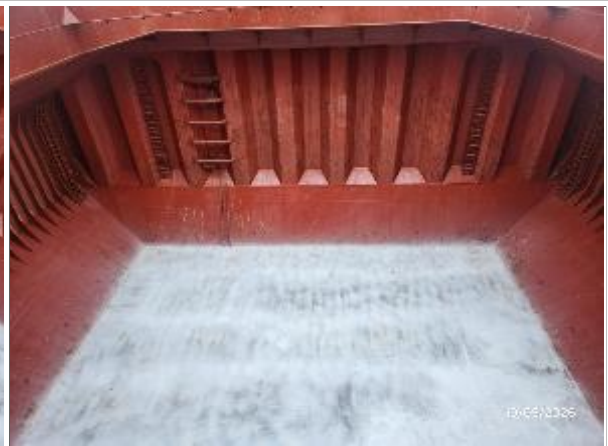
6. Vista de proa y fondo encalado.