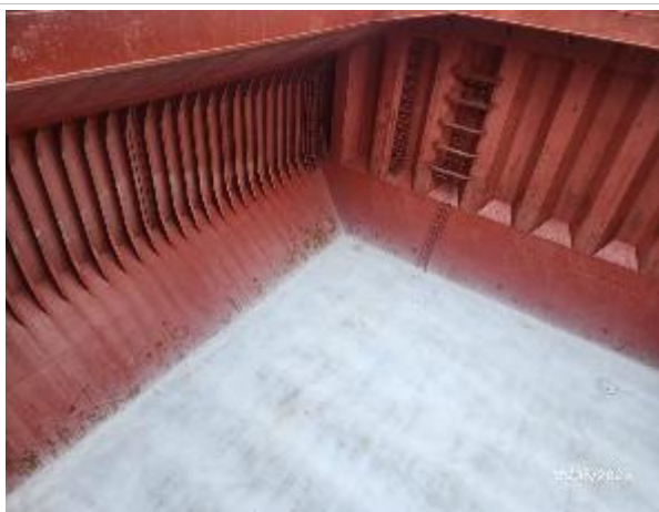
15. Banda de estribor encalada.