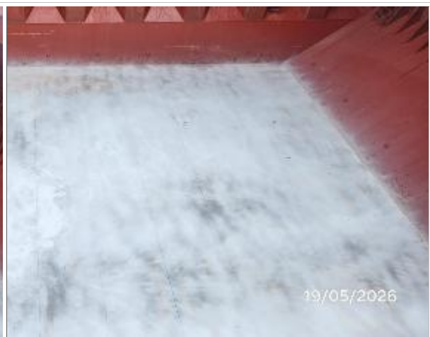
8. Fondo de la bodega No. 2.