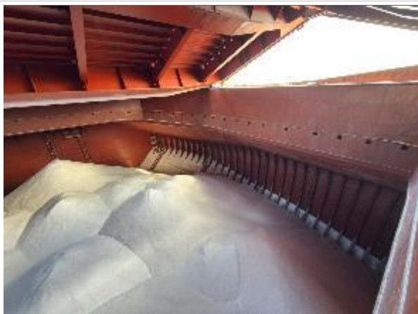
21. Proa de bodega N° 1 cargada.