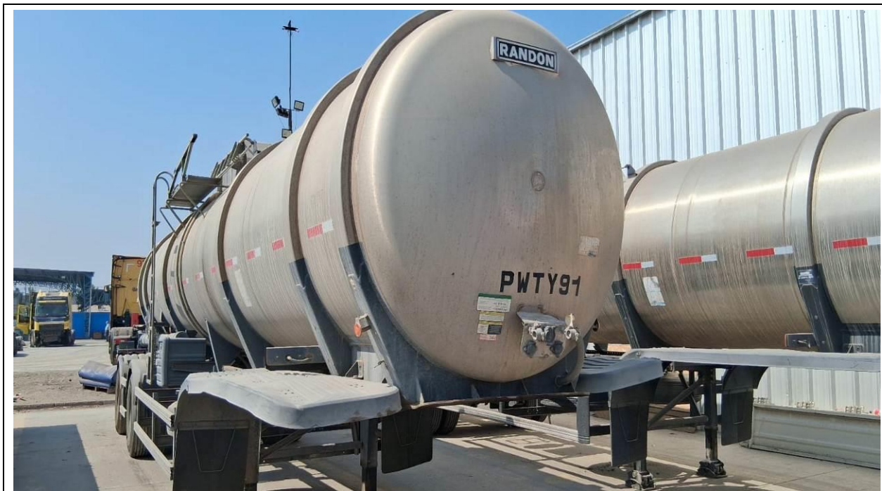
10.- Vista general del equipo.