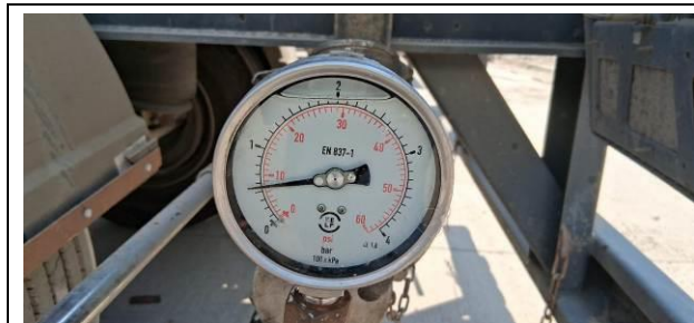
1.- Vista del manómetro a 8 PSI.