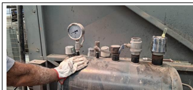
1.- Válvula de alivio.