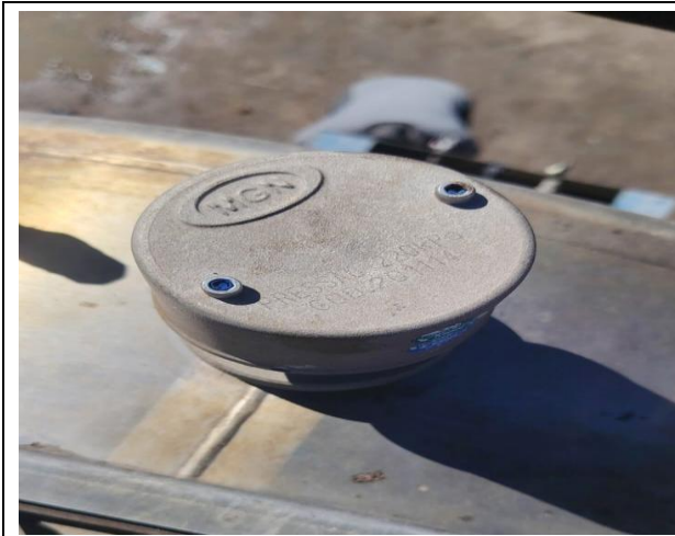
1.- Válvula de alivio.