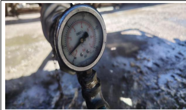
1.- Vista del manómetro a 8 PSI.