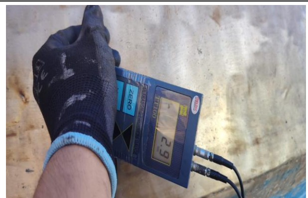
2.- Vista de medición.

Nota muy importante: Si correspondiesen acciones correctivas (por no conformidades, n/c), estas deberán ser solucionadas o tratadas por el cliente en el menor tiempo posible con el fin de reducir los riesgos asociados de mantener en operación un equipo sub-estándar.