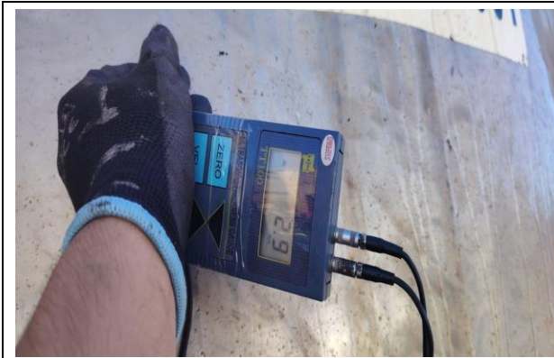
1.- Vista de medición.