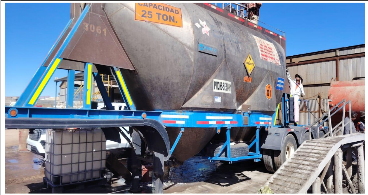
10.- Vista general del equipo.