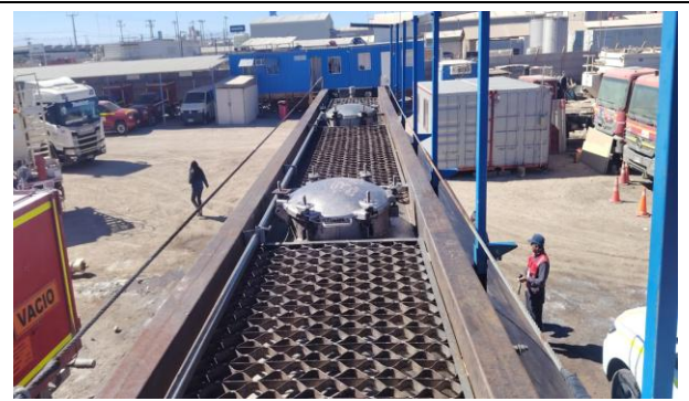
2.- Otra vista (fuga, general, ductos, tapa).