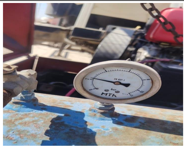
2.- Manómetro al momento de liberación.