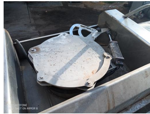
2.- Otra vista (fuga, general, ductos, tapa).