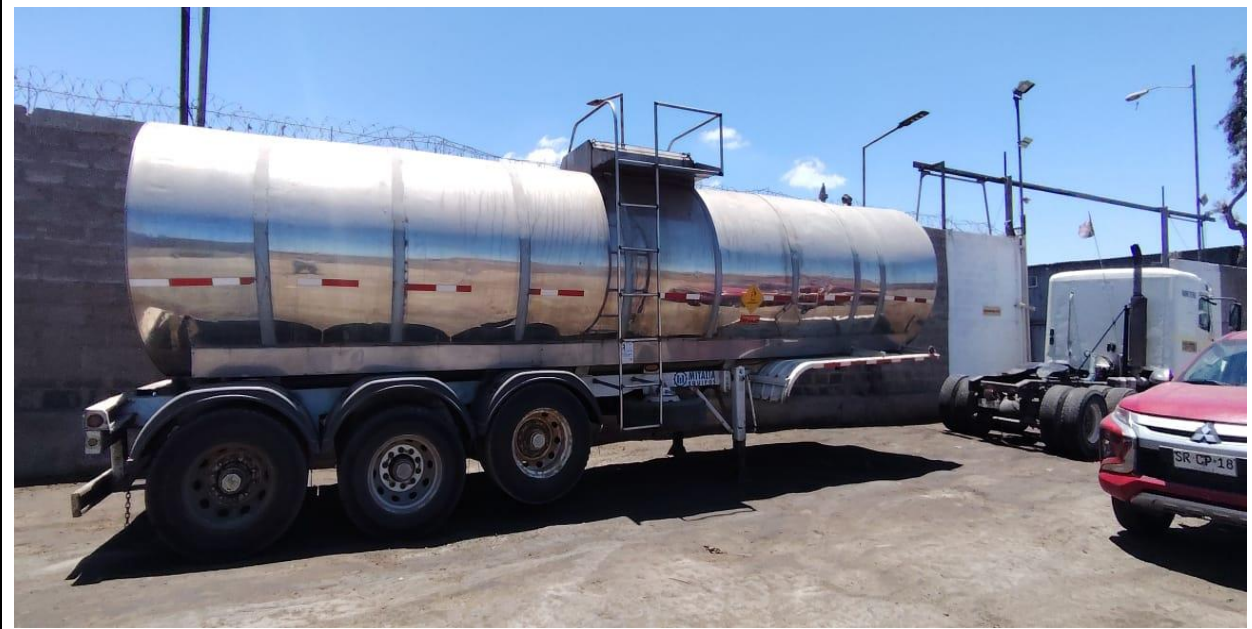
10.- Vista general del equipo.