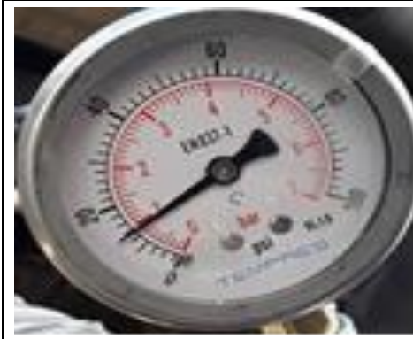
1.- Vista del manómetro a 8 PSI.