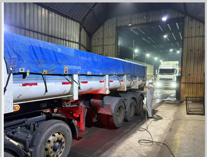
2. Vista general del correcto encarpado de las tolvas antes de su despacho.