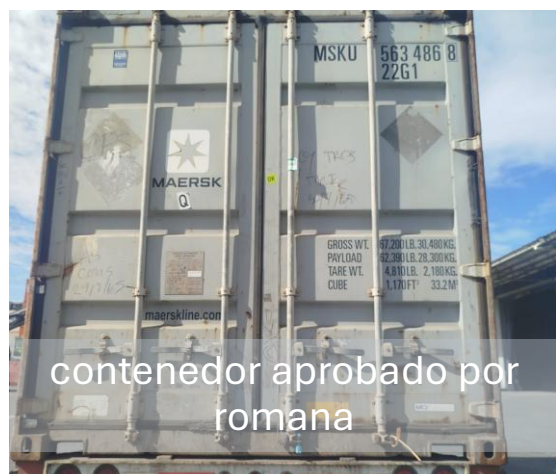
contenedor aprobado por romana