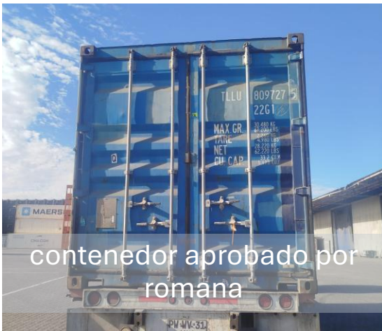
contenedor aprobado por romana