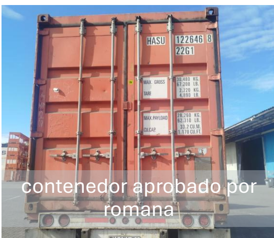
contenedor aprobado por romana