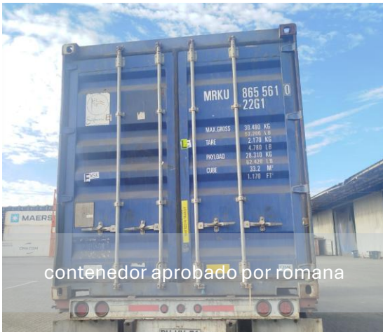
contenedor aprobado por romana