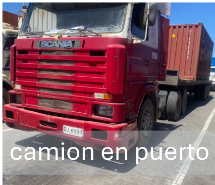
camion en puerto