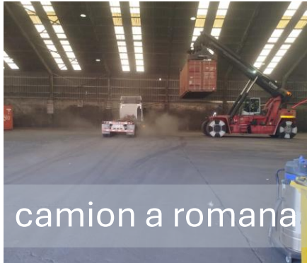
camion a romana