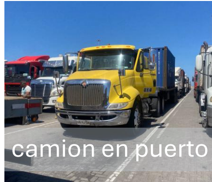
camion en puerto