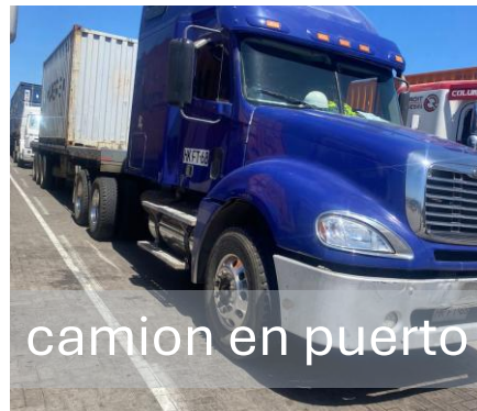
camion en puerto