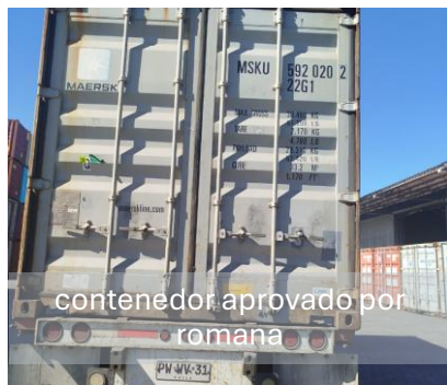
contenedor aprobado por romana