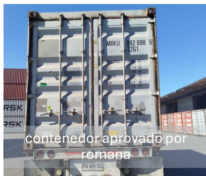
contenedor aprobado por romana