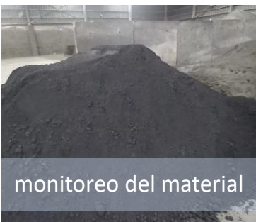
monitoreo del material