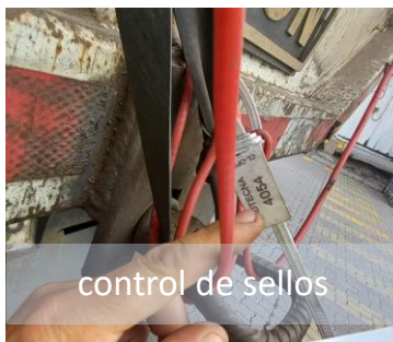
control de sellos