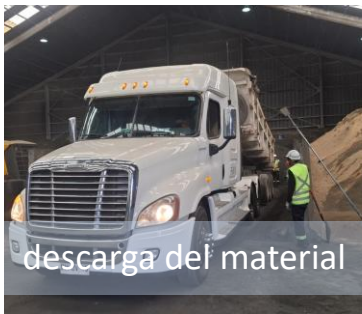
descarga del material