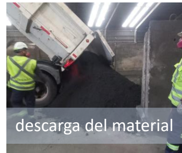
descarga del material