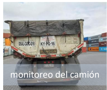
monitoreo del camión