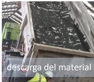
descarga del material