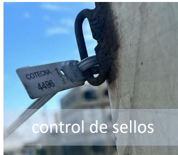
control de sellos