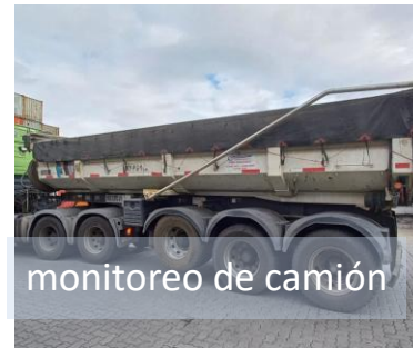
monitoreo de camión