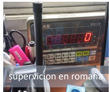
supervisión en romana