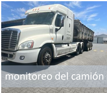
monitoreo del camión