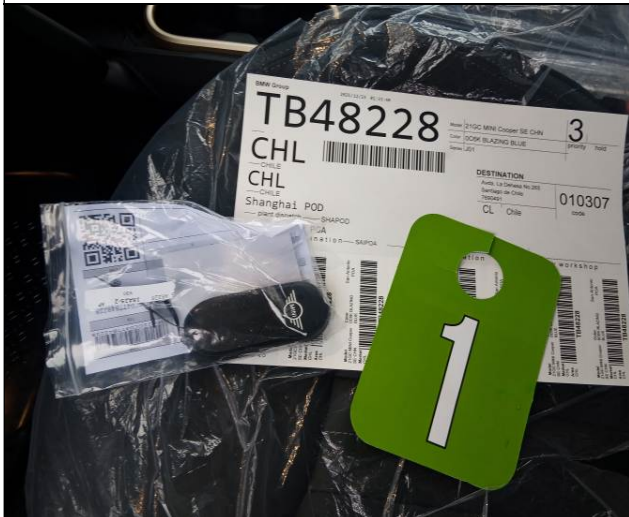
7. 8. Mando a distancia y key card observadas.