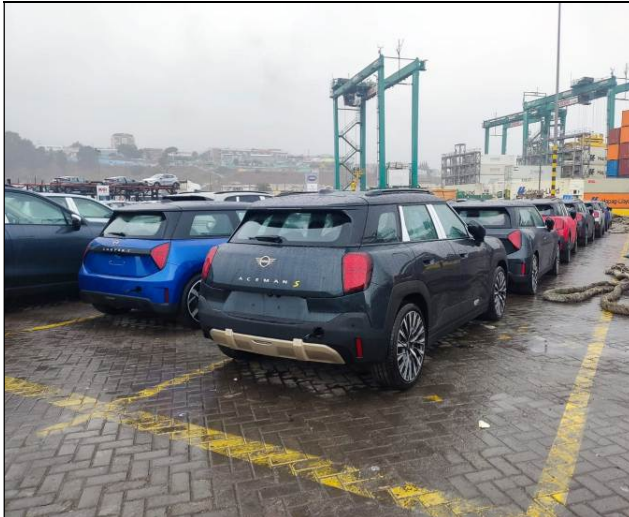
5. Vista trasera del área de estacionamiento.