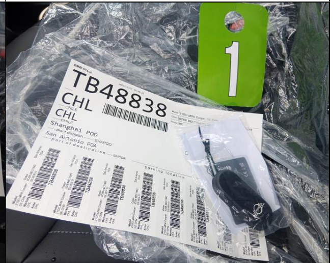
8. Mando a distancia y key card observadas.