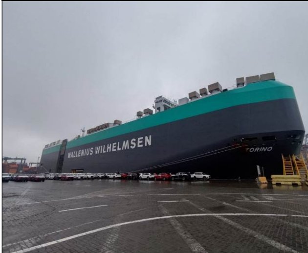
1. M/N TORINO V-VS606, atracada en sitio N° 4/5, DP WORLD.