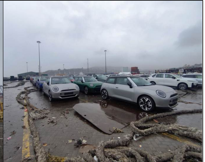
2. Área de estacionamiento unidades MINI.