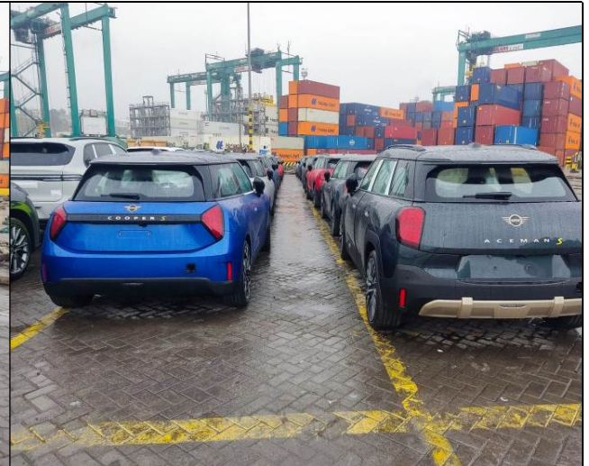
6. Otra vista de lo anterior.