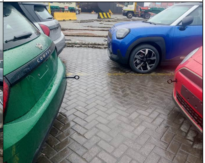
4. Separación entre unidades MINI.