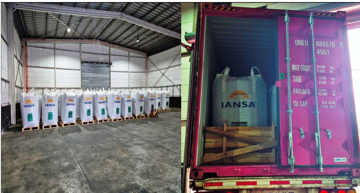
1. Vista producto almacenado en bodega.

Posterior al pesaje del contenedor en romana, se procede al sellado de este en la puerta correspondiente con sello asignado por la naviera en conjunto con sello ALS .