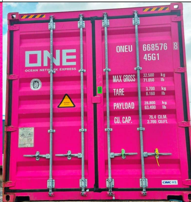
6. Vista de contenedor sellado.