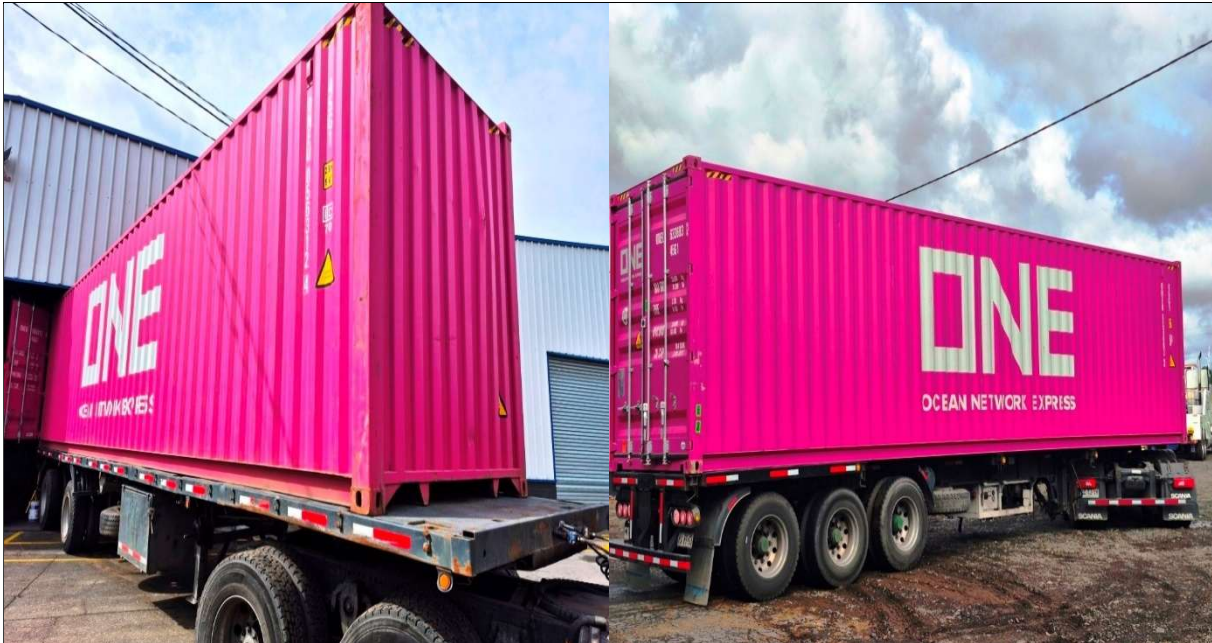
3. Vista costado contenedor en inspección.